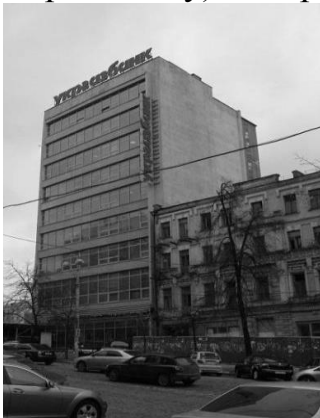
Рис. 7 Будівля Республіканського «Будинку моделей» (зараз будівля Укргазбанку), 1969 р., функціоналізм

Прикладом невдалого вторгнення в історичну забудову може також служити будівля Республіканського «Будинку моделей» Міністерства побутового обслуговування населення УРСР, побудована в 1969 році (зараз будівля Укргазбанку) за адресою вул. Вел. Васильківська, 39 (рис. 7).