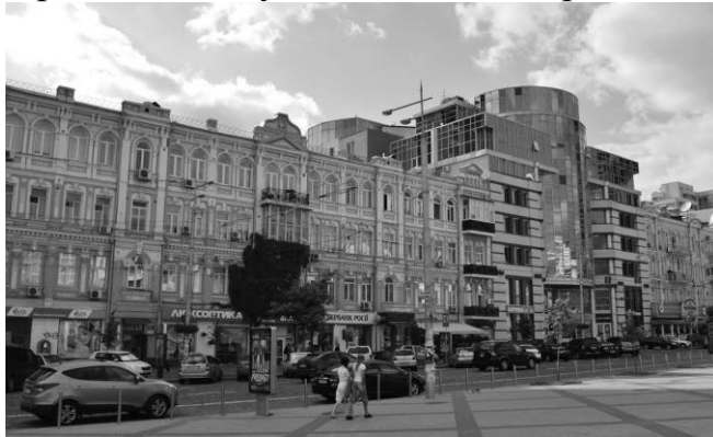
Рис. 6 Бізнес-центр «Сіті Плаза», 2003 р., арх. О. Донець

Контрастне рішення має, на жаль, і невдалі приклади. До цих випадків більш підходить слово дисонанс. Так, наприклад, масивна будівля бізнес-центру «Сіті Плаза» з досить грубим фасадом зі скла і бетону по вул. Вел. Васильківська 62/64 неделікатно розриває ряд витончених історичних фасадів у стилі неоренесанс, створюючи враження деякої зневаги до історичного минулого тільки підкреслюючи її чужорідність. (Див. рис. 6)