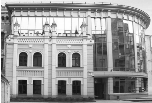
Рис. 5 Адміністративна будівля, 2013 р., гол. арх. О. Коваль

Контрастне рішення має, на жаль, і невдалі приклади. До цих випадків більш підходить слово дисонанс. Так, наприклад, масивна будівля бізнес-центру «Сіті Плаза» з досить грубим фасадом зі скла і бетону по вул. Вел. Васильківська 62/64 неделікатно розриває ряд витончених історичних фасадів у стилі неоренесанс, створюючи враження деякої зневаги до історичного минулого тільки підкреслюючи її чужорідність. (Див. рис. 6)