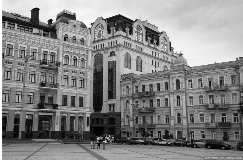
Рис. 1 Адміністративна будівля, 2010 р., Архітектурне бюро «Смирнов і К°»

Ще одним вдалим прикладом є будівля офісно-торговельного центру на вул. Верхній Вал 68, виконана за проектом Архітектурного бюро «О. Коваль» (у складі ВАТ «Київпроект»). (Див. рис. 2)