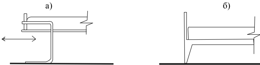
Рис.1. Решение изголовий кровати в санаторных палатах

а) Изголовье кровати в санатории в Паймио; б) Классическое решение.