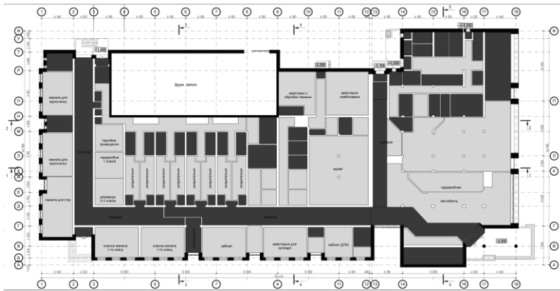
План 1-го поверху школи

До незмінюваної частини будівлі можна віднести приміщення, пов'язані з активною експлуатацією інженерних мереж – санвузли, щитові, мийочні, пральні, виробничі цеха кухні, радіовузол тощо . Оскільки, при трансформації об'єкта, в більшості випадків перекладка мереж є економічно та технологічно недоцільною, на цих ділянках скоріш за все будуть розташовані приміщення подібного призначення. Характер простору та діяльності можуть незначно змінюватися, але в цілому структура буде зберігатися.