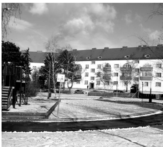
Рис. 2. Джордж-Вашингтон-Хоф, м. Відень, Австрія, 1927-1930 рр