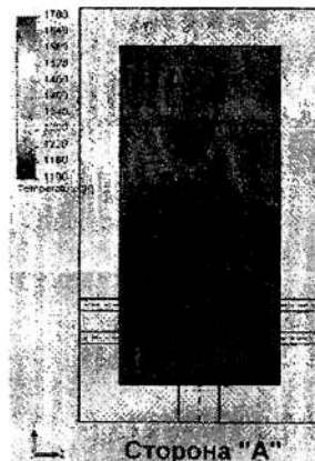
Рис. 2. Температурне поле в топці котла ПТВМ-30м перед встановлення штатними пальниками

У першому випадку необхідно чекати зменшених значень \text{NO}_x на виході з котла, а в другому - підвишених.