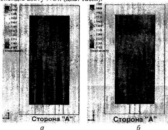
Рис. 3 Температурне поле в топці котла ПТВМ-30м до встановлення у поду пальниками SG-150 без крутіння (а) і з крутінням (б)

Результати моделювання були перевірені при аналізі даних налагодження і еколого-теплотехнічних випробувань реконструйованого котла ПТВМ-30м в районній котельні у м. Вінниця, де в поду топки були встановлені два пальники SG-150 виробництва фірми SAACKЕ GmbH (ФРН). Були проведені дослідження режимів горіння газу при повній відсутності та при максимально можливому крутінні. При цьому спостерігалось розходження даних щодо складу димових газів, а саме концентрації оксидів азоту \text{NO}_x (див. табл.).