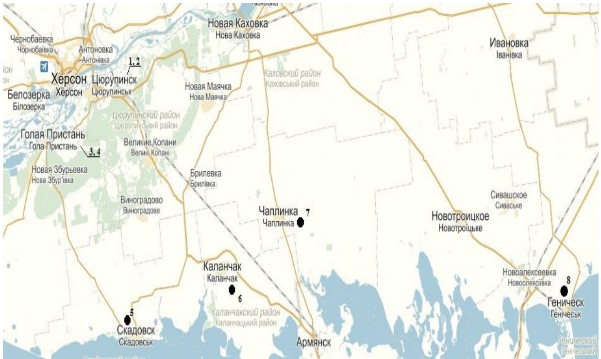
Рис.1. Територіальне місцезнаходження свердловин

рішень задач руху підземних вод фахівцями СКТБ Інституту гідромеханіки НАН України, показало незначну їх відмінність [1].