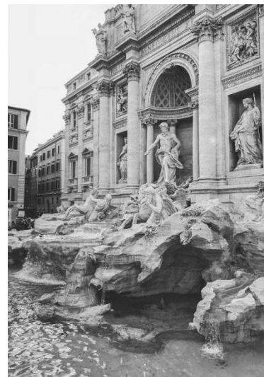
Рис. 4. Фонтан Треві. Рим. Архітектори Нікола Сальві, Джузеппе Панніні. 1735 р.