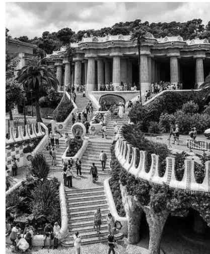
Рис 6. Сценографія маршруту вздовж парадних сходів парку Гуель. Барселона. Архітектор Антоніо Гауді. Дата заснування: 1900- 1914 р. https://eng.travelogues.gr/item.php?view=57799

Отже, можна стверджувати, що емоційні і смислові навантаження, які притаманні різним мистецтвам, відіграють вагому роль в формуванні архітектурних просторів.