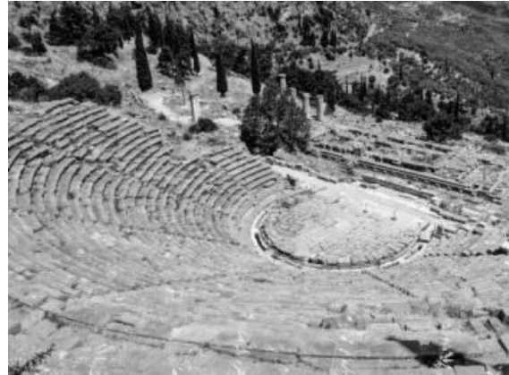
Рис. 2. Театр Аполлона. Дельфи.

https://www.greecevillasrentals.com/5-great-reasons-to-visit-athens-greece