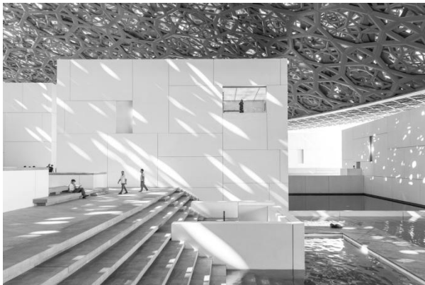
Рис. 7. Двір музею Лувр. Абу-Дабі. Архітектор Жан Нувель. 2017 р. https://www.archdaily.com/883202/jean-nouvel-louvre-abu-dhabi-photographed-by-laurian-ghinitoiu

Розподілення уваги відвідувача, як на експонати, так і на архітектурно-просторові прийоми, які породжують різні стани, створює певну динаміку у сприйнятті. Це, в свою чергу, спонукає контактувати з музеєм на особистий розсуд. Людина має вибір вивчати мистецтво, споглядати експозиційні зали, брати участь в інтерактивних виставках, насолоджуватися атмосферами просторів, що приваблює відвідувача бути причетним до культурного життя. Однозначно можна стверджувати, що досвід, який переживає людина в такому просторі є унікальним, що формує нове відношення до мистецтва і культури в цілому.