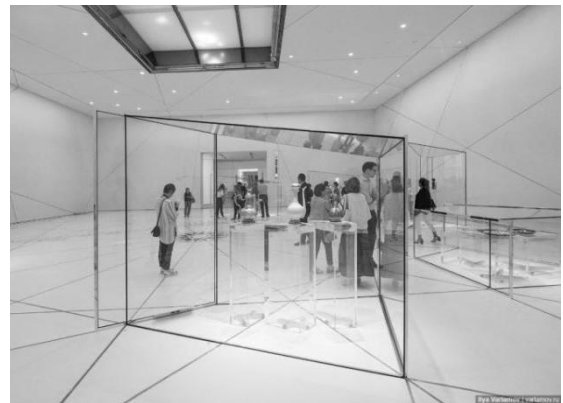
Рис. 8. Один із експозиційних залів Лувру. Абу-Дабі. Архітектор Жан Нувель. 2017 р. https://varlamov.ru/2879262.html

Декоративне оформлення подій архітектурою можна прослідкувати і на прикладі Версальського парку створеного Андре Ленотром. Основні напрямки, алеї, перетинається у сприйнятті елементами, які відображають різні смисли і несуть різні емоційні навантаження. Це і фонтани, озера, канали, статуї, ландшафтні декорації, відкриті площадки, які змінюються під час руху людини і, таким чином, створюють естетично виразний простір, що вражає і зацікавлює до взаємодії з середовищем. Шлях, який долає відвідувач, хоча він визначений основною прямою, насичений емоційними враженнями, які змінюються під час руху. Шервинський стверджує: “Версаль у виключній повноті свого впливу дає зразок найвищого прояву прийомів перспективи, покладених в основу всього паркового комплексу, а відкриваючи далі в осьовому напрямку, створює враження безмежної глибини простору [19]”. В такому випадку, простір зацікавлює людину рухатися у визначеному напрямку акцентуючи увагу на орієнтир. Також парк вміщує більш камерні простори, призначені для