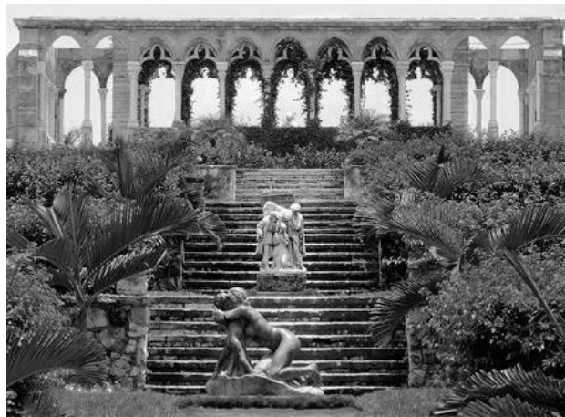
Рис. 9. Фрагмент палацово - паркового ансамблю. Версаль. Архітектор Андре Ленотр. 1682 р.

http://art-labirint.msk.ru/versal-park-foto.html