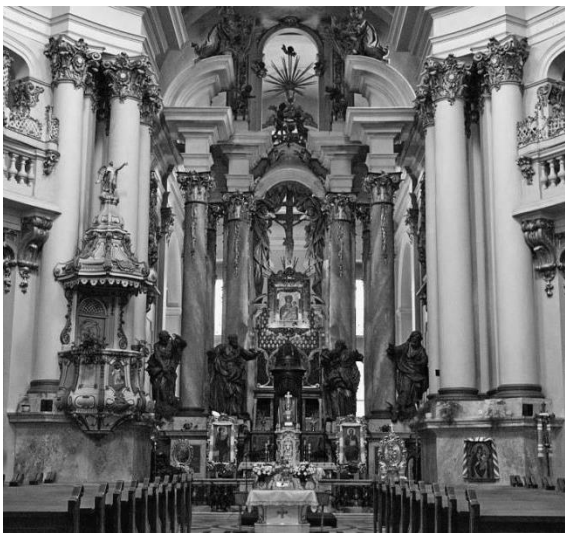
Рис. 3. Інтер'єр собора Святого Юри. Львів. Архітектор Бернанд Меретин. 1760 р.

На відміну від архітектури давньої Греції, стиль Бароко вирізняється насиченістю архітектурними прийомами, які виникають в контексті різних мистецтв, це і скульптура, і декоративно-прикладні, художні мистецтва, що доповнюються тимчасовими, наприклад, як проявлення динаміки простору за рахунок світла (Рис. 3., Рис. 4.). В парадних інтер'єрах архітектура зливається з багатобарвною скульптурою, ліпниною, різьбою; дзеркала і розписи ілюзорно розширюють простір, а плафонний живопис створює ілюзію склепінь [12].