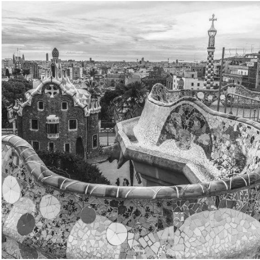
Рис 5. Вид із однієї площадки в парку Гуель. Барселона. Архітектор Антоніо Гауді. Дата заснування: 1900 - 1914 р.

Яскравим прикладом синтезу мистецтв може слугувати стиль модерн, який виникає в контексті декоративно-прикладних, художніх мистецтв, літератури з просторовою формою. Так, наприклад, парк Гуель архітектора Гауді виступає декорацією до прогулянки, яка розкривається у таких прийомах, як мозаїка, скульптура, пластичні форми конструктивних елементів, які сприймаються у визначеній послідовності (Рис.5., Рис. 6.).