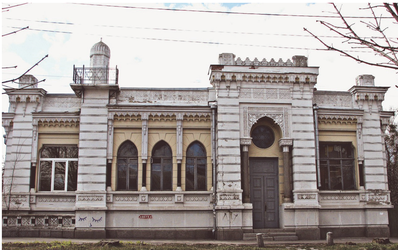
Рис. 1. Будинок по вул. Паризької Комуни, 15

У 2008 році була зроблена спроба розробити проект реконструкції колишнього особняка під готель, однак проект так і не був реалізований. З 2008 року будинок відселений і стоїть пусткою (рис.1,2)