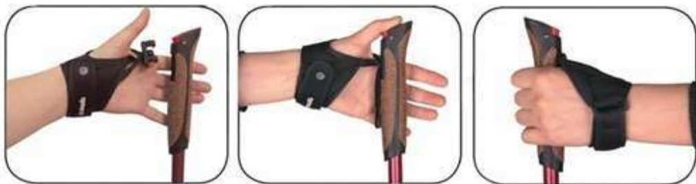
Рис.5. Правила тримання палиць для скандинавської ходьби

Рекомендується: палицю потрібно тримати між вказівним і великим пальцями (рис. 11).