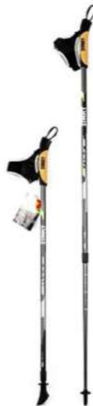
Рис.4. Телескопічні палиці

Інший інвентар не настільки принциповий. Для занять скандинавською ходьбою підійдуть будь-які кросівки та спортивний одяг. Головне, щоб вони були зручні. Хоча у спеціалізованих магазинах зустрічається і відповідне екіпірування для ходьби. Єдине зауваження – необхідно якимось чином оберігати литки, щоб випадково не подряпати їх палицями, які мають гострий накінечник. Можна використовувати також фітнес-браслети для контролю калорій, що витрачаються; пульсометри і трекери, призначені для контролю маршруту.