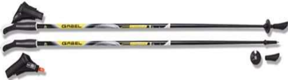
Рис. 6. Фіксовані (цільні) палиці