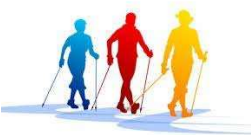
Рис.7. Схематичне зображення людей різного віку під час заняття скандинавською ходьбою

Чи є медичні протипоказання для скандинавської ходьби? Їх не так вже й багато (рис. 7). Перш за все, це важкі форми серцево-судинної недостатності, діабету і тромбофлебіту, запальні процеси черевної порожнини і малого тазу, загострення хронічних захворювань, декомпенсація органів, підвищена температура, нещодавно проведені операції, стенокардія, гіпертонічна криза, сколіоз, порушення вагітності, які загрожують викиднем. Якщо ви страждаєте на якесь захворювання і сумніваєтеся, чи можна при цьому займатися оздоровчою ходьбою, то рекомендується звернутися за порадою до лікаря.