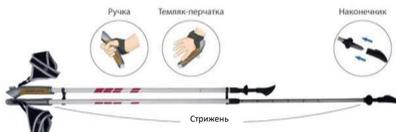
Рис.3. Палиці для заняття скандинавською ходьбою

Для заняття скандинавською ходьбою потрібні лише палиці. Проте варто зазначити, що звичайні лижні палиці, якщо і підійдуть, то далеко не завжди. Як бачимо (рис. 3), палиці для ходьби повинні бути коротші, ніж лижні палиці. Це пов'язано з тим, що при ходьбі людина лише спирається на палиці, а не відштовхується ними.