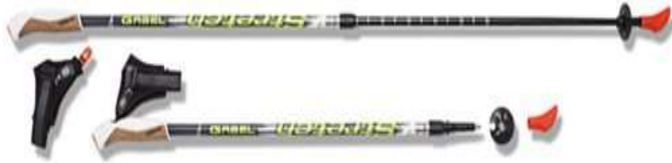
Рис. 5. Телескопічні палиці

Таким чином, скандинавські палиці бувають двох видів: