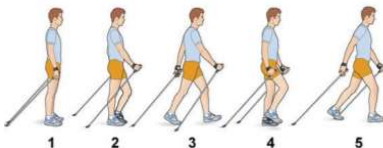
Рис.10. Порядок виконання скандинавської ходьби

Ходьбою в основному займаються люди похилого віку[4]. Правила скандинавської ходьби з палицями для літніх нічим не відрізняються від загальних правил (рис. 10). Серед початківців можуть бути і люди, які перенесли травми.