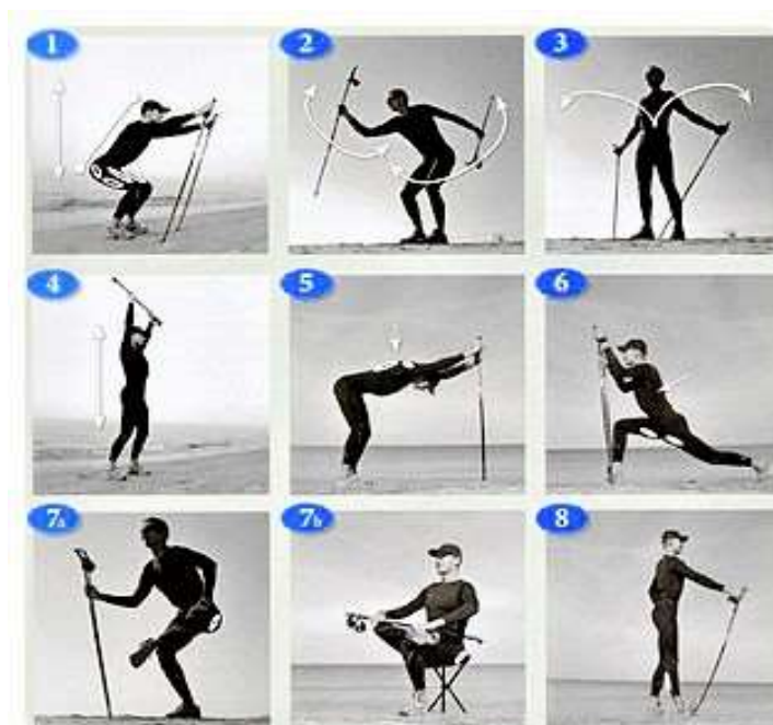
Рис.13. Види вправ для підготовки до занять скандинавською