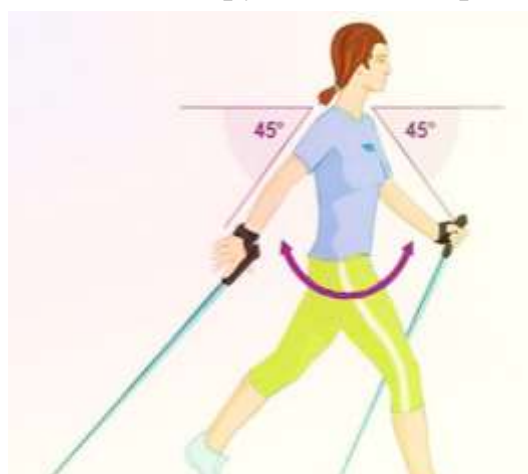
Рис.9. Правильна постава під час занять скандинавською ходьбою

Ходьбою в основному займаються люди похилого віку[4]. Правила скандинавської ходьби з палицями для літніх нічим не відрізняються від загальних правил (рис. 10). Серед початківців можуть бути і люди, які перенесли травми.