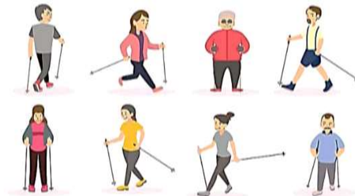
Рис. 2. Скандинавська ходьба – для всіх

Оздоровчим типом ходьби може займатися практично будь-яка людина (рис. 2). Найбільшу популярність отримала ходьба з палицями як ефективний спосіб реабілітації та лікування хворих на серцево-судинні захворювання, захворювання опорно-рухового апарату (остеохондроз, ушкодження хребта); людей, які страждають на порушення вестибулярного апарату, хвороби легень, нервові розлади, безсоння,