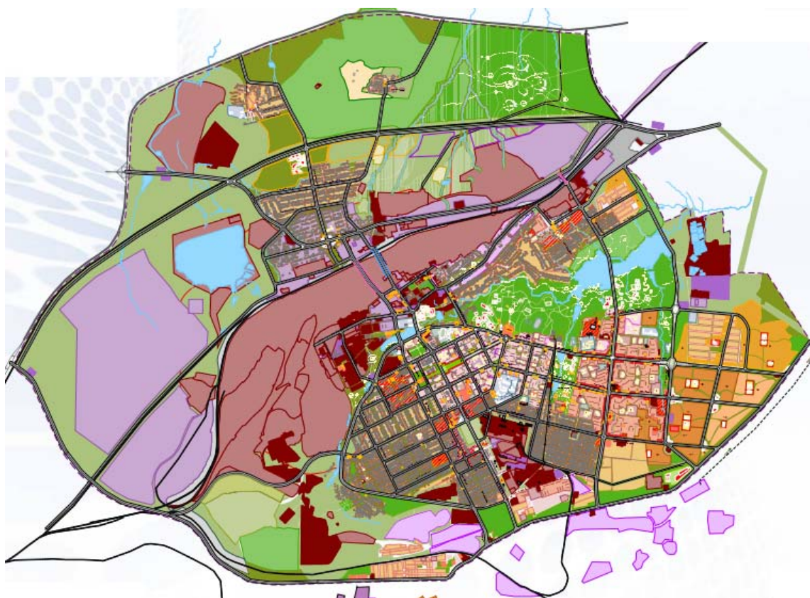
Рис 2. Проектні пропозиції щодо покращення вулично-дорожньої мережі міста.

ВДМ Алчевська представлена магістральними вулицями загальноміського та районного значення. Нажаль, більшість вулиць не відповідає нормативам за своїми технічними параметрами. Загальна довжина магістральних – 88 км; загальноміського значення – 47,8 км; регульованого руху – 40,2 км. Щільність транспортної мережі – 21 км/км 2 .