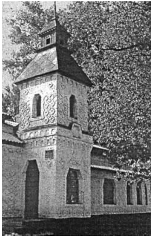
Рисунок 2 – Будинок школи в с. Западинці Лохвицького району. Сучасний вигляд

Будівлі земських шкіл мали декілька вхідних отворів (головні та допоміжні). Головний вхід завжди був підкреслений двоповерховою вежею, що також сполучала між собою два блоки: учбовий блок та блок житлових і допоміжних приміщень. В одно- та двокласних школах вежа підкреслювала асиметричність архітектурно-композиційного вирішення будівлі, а в три- та чотирикласних школах, де панувала симетрія, – веж було дві. Чотирикласні школи мали найбільш пластичне вирішення головного фасаду завдяки трьом висунутим вперед об'ємам, середній з яких фланкували дві вежі. Ці вежі були перекриті наметовим дахом зі шпилем (рис. 2). Портали мали трапецевидну шестикутну форму з обрамленням.