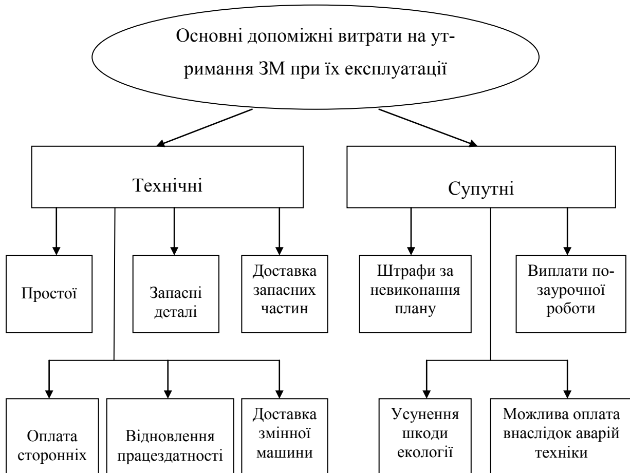
Рис. 2. Витрати коштів на допоміжні операції процесу використання ЗМ.

Збиток у загальному випадку може бути функцією часу простою, так як тривалість простоїв пов'язана з інтенсивністю відмов і часом відновлення [3].