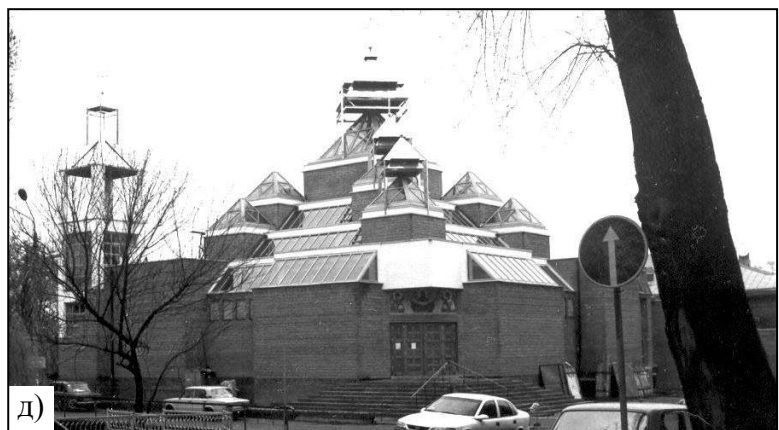
Рис. 3. Сучасні храми Києва. Православні (Московського патріархату): а), б) сакральний комплекс, просп. Миру, 16; а) церква Агапіта Печерського; б) хрещальня біля церкви Входу Господнього в Єрусалим; в) Михайлівська церква, вул. Шовковична, 39/1, на території лікарні; г) Георгіївська церква, вул. Ползунова, напроти південного залізничного вокзалу; д) Василівська церква (греко-католицька), Вознесенський узвіз, напроти Академії образотворчого мистецтва і архітектури.