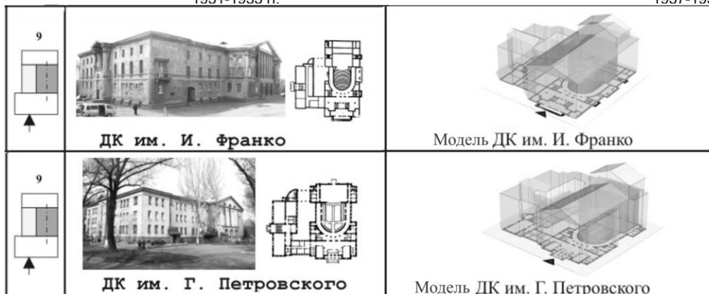
Рис. 5. Архитектура и композиционные модели клубных зданий г. Донецка

Выводы. Задачи градостроительства влияли на архитектуру клубных зданий и определялись характером отношений к организации пространства города. В соответствии с градостроительной теорией урбанистов на первом месте была композиционная организация пространства, здание фиксировало общественный центр поселка, выполняя ведущее идеологическое значение в населенном пункте. Пространственные средства архитектуры рационалистов – гладкие плоскости стен фасада в ДК им. И. Франко при реконструкции