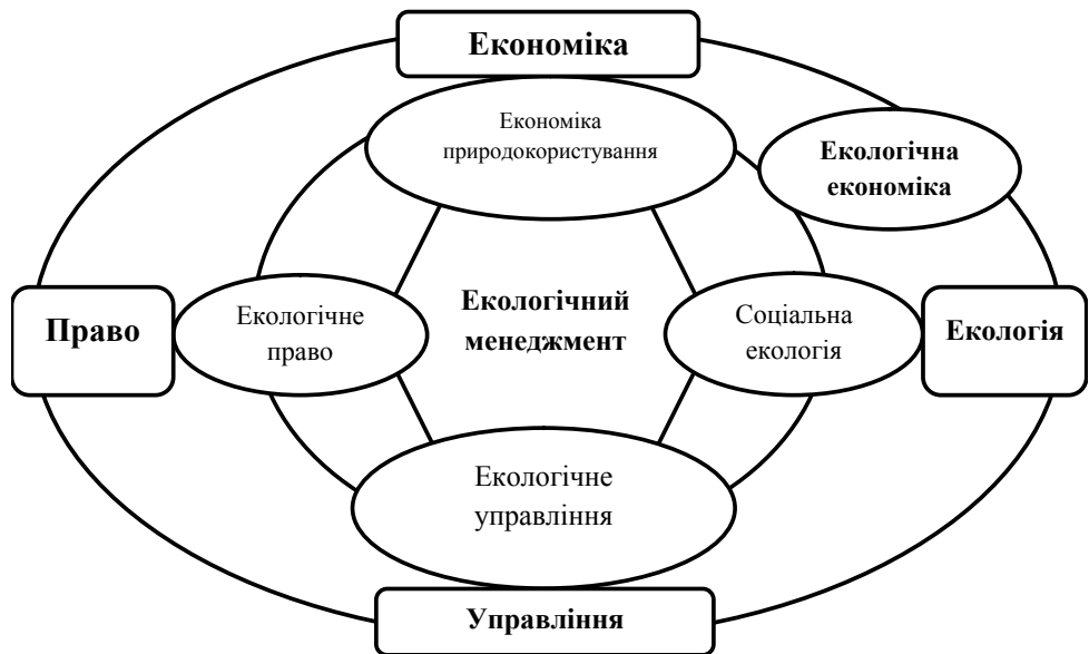
Рис. 1. Складові екологічного менеджменту

У процесі проведення екологічного менеджменту необхідно, насамперед, глибоко проаналізувати техніко-економічну й фінансову ситуацію. Перше питання, на яке необхідно знайти відповідь, — це визначити (встановити) вид продукції, який вироблятиме підприємство для відновлення свого потенціалу та нормального функціонування. Цьому передують аналіз усіх напрямів діяльності підприємства за критерієм конкурентоспроможності продукції (ціна, якість), ринкової частки, струк-