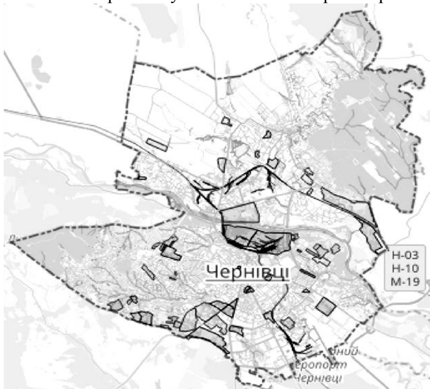
Рис. 2. Детальні плани територій міста Чернівці [12]

Житловий фонд, цивільний захист. Інтегрована концепція розвитку міста. Бюджет ініціатив. Соціально-культурні об'єкти. Тимчасові споруди. Документи дозвільного характеру. Реєстр адрес, вулиць та інших поіменованих об'єктів. Вибірчі ділянки. Детальні плани територій (рис. 2). Дитячі майданчики. Історико-архітектурний план. Нерухоме майно. Парки та сквери. Перелік місць та зон виходу собак. План розвитку міста 2018/2019 Транспорт.