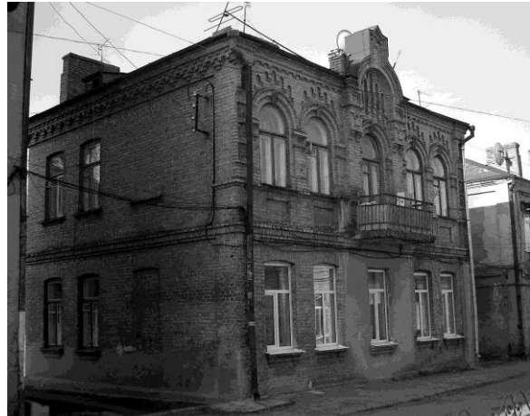
Рис.2. Житловий будинок по вул. Кривий Вал, 10 в Луцьку

При невеликих фізичних розмірах будинку у більшості випадків непарна кількість осей вже сама собою надавала фасаду завершеності. При цьому, як правило, архітектура дворових фасадів вирішувалась за спрощеною схемою: без виділення композиційного центру і з мінімальною кількістю декору. При розплануванні застосовувались, як і на поч. XX ст., переважно 2-квартирні секції з центральним розташуванням двох сходових кліток: парадної – зі сторони вуличного простору і “чорної” – зі сторони двору. Відповідно здійснювалось групування житлових і підсобних приміщень квартир. При цьому санітарно-гігієнічні приміщення не передбачались (I-а пол. 1920-х рр.) або виносились у планувально відокремлений від квартир блок з входом зі сходової клітки.