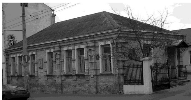
Рис.4. Житловий будинок по вул.Б.Хмельницького, 12 в Луцьку

Своєрідний місцевий варіант “раціоналізації” архітектурного образу був запропонований у численних проектах секційних житлових будинків для забудови “престижних” вулиць Рівного, виконаних архітектором Гжегожем