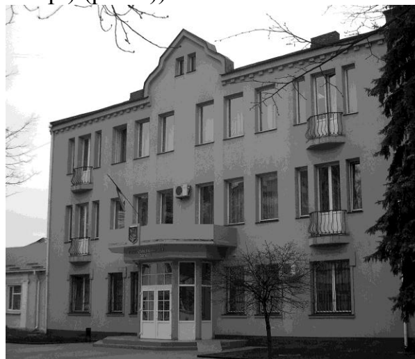
Рис.6. Житловий будинок по вул.16 Липня в Рівному

Дослідження показали, що при проектуванні індивідуальних житлових будинків, розташованих в кварталах щільної (фронтальної) забудови, перевага віддавалась формотворчим прийомам модерну. Асиметрія головного фасаду, характерна для цього стилю, була найбільш “зручною” в умовах обмеженого розмірами ділянки фронту забудови. Крім того, в такий спосіб ще раз підкреслювалася “реконструкція” соціальної структури населення волинських міст з акцентом на її “демократизацію”, стирання верстових і, у нашому випадку, етнічних відмінностей. З іншого боку, стилістика модерну, що за визначенням була “антибуржуазною”, представляла на Волині саме цей суспільний клас.