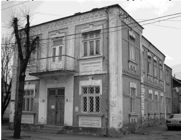
Рис.7. Житловий будинок по вул.16 Липня 35/45 в Рівному

Протягом 1920-поч.30-х рр. характерною рисою архітектурного вирішення деяких з числа прибуткових житлових будинків було творення синтетичного образу, композиційно і морфологічно спорідненого зі стилістикою раціоналізму, модерну і класицизму одночасно. Особливість полягала у поєднанні класицистичних (або модерністичних) прийомів побудови фасадів, оперуванні елементами, характерними для “цегляного” стилю (профільовані карнизи і тяги, обрамлення вікон з фігурної цегли) і модерну (декорування лопаток на фасадах, підвіконних ніш, решітки огороження балконів, козирки над входами). Важливу роль при цьому відіграло художнє трактування опоряджувальних матеріалів, які перетворювались на один з засобів архітектурної виразності, що дозволяє констатувати наявність впливів архітектури модерну. Втім, асортимент застосовуваних матеріалів у волинській архітектурі був порівняно скромним. Зокрема, провідне значення отримало співставлення фактур поверхонь, де гладка штукатурка і світлий тон декоративних елементів контрастували з опорядженням лицевою цеглою стінових площин і оголеною сухістю металевих деталей (буд. в Рівному по вул. Соборній, 76 (1925 р.); по вул. 16 Липня, 35/45 (1926 р.) (рис.7); вул. Чорновола, 58 (1924 р.) (1924-26 рр.); по вул. Дорошенка, 3 (1926 р.)); по вул. Міцкевича, 33 (1926 р.); по вул. Соборній, 141 (1927 р.); по вул. Згода, 29 (1927 р.); вул. Спудільчій , 5 (1920-ті рр.), по вул.Словацького, 10 (1920-ті рр.) (рис.8).