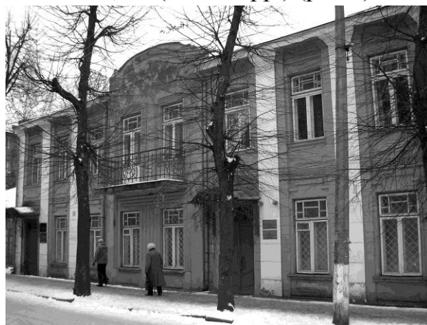
Рис.8. Житловий будинок по вул.Словацького, 10 в Рівному

Висновки. Підсумовуючи, необхідно відзначити, що усі проаналізовані підходи до формування образу житлових будівель в містах Західної Волині у 1920-х рр. застосовувалися синхронно, хоча і в очевидній прив’язці до типу житлового будинку. Визначальну роль у якості кінцевого результату відіграла архітектурно-будівельна традиція попереднього, російського, періоду історії регіону, представлена у багатьох випадках як авторські