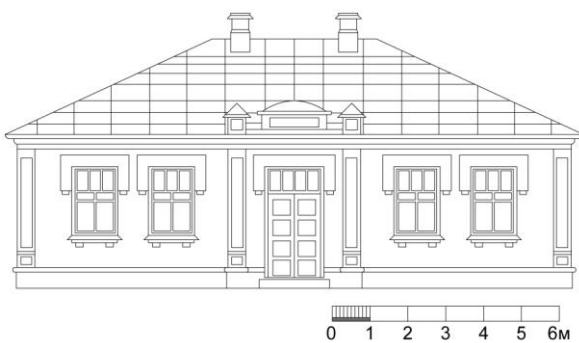
Рис.3. Проект житлового будинку по вул. Островського, 11 в Рівному [7]

Із застосуванням аналогічних композиційних прийомів формувався архітектурний образ одноповерхових садибних будинків (будинки в Рівному по вул. Пушкіна, 10 (1927 р., арх. С.Німенський); по вул. Грабник, 210 (1927 р.) [7] (рис.3); по вул. Островського, 11 (1928 р.); по вул. Дубенській, 4 (1927 р.); в Луцьку: по вул. Б.Хмельницького, 12 (1932 р., арх. Т.Садковський) (рис.4.)).