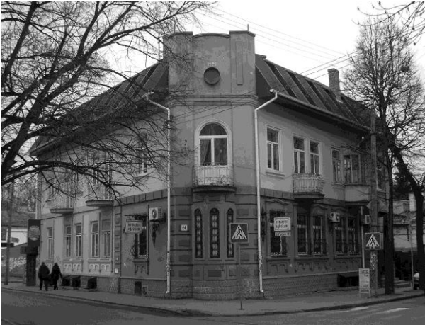
Рис.1. Житловий будинок по вул. 16 Липня, 61 в Рівному

тими ж принципами, що і в попередній період. Повторювані по горизонталі і вертикалі комірки-квартири зумовлювали появу на їх площинах своєрідної віконної “сітки” – основу ритмічної побудови і ознаку відкритості для розвитку композиції вздовж вулиці. Втім, невелика протяжність об’ємів нівелювала потенційну монотонність фасадів, характерну для будівель значного масштабу, споруджуваних в кінці XIX – на поч. XX ст. у великих містах Російської імперії і губернських центрах. Центрально-осьова структура фасадів виражалась декількома способами. Перший (найвідповідніший класицистичним принципам побудови) – шляхом закріплення головної осі ризалітом вхідного вузла або вінчаючим фронтоном, і підпорядкування їй інших частин (будинки в Рівному по вул. Дубенській, 15 (1926 р.); вул. С.Петлюри, 11 (1926 р.); вул. Чорновола, 15 (1927 р.); вул. 16 Липня, 61 (1928 р.) (рис.1.); вул. І.Мазепи, 31 (1928 р.); в Луцьку – по вул. Кривий Вал, 10 (1927 р.) (рис.2)).