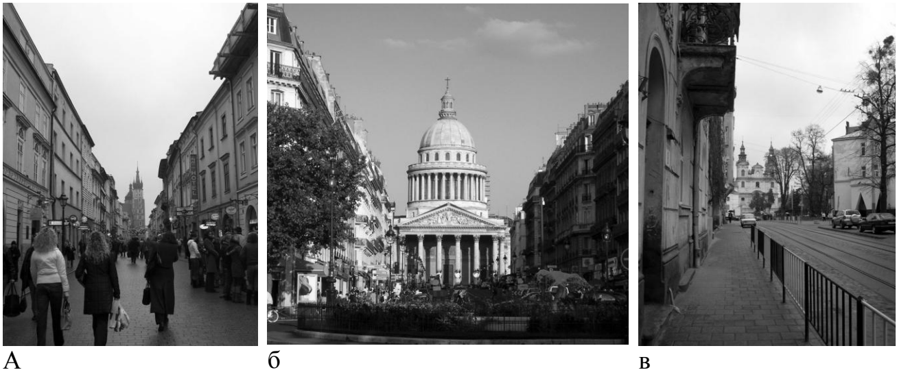
Рис. 3. Приклади вулиць, завершених сакральними спорудами: а – Краків; б – Париж; в – Львів.

3. Канонічні принципи. Окрім композиційних та функціональних принципів розташування сакральних об'єктів в системі міста, необхідно витримати і канонічні. Канонічна орієнтація храму залежить від віровизнання та обряду, до якого належить громада. Мусульмани моляться у бік найбільшої святині Ісламу – Кааби. Відповідно, священна вісь мечеті орієнтована у бік Мекки. Християни, в залежності від приналежності до обряду – на схід або захід. Українські церкви, у відповідності до східного обряду, мають бути канонічно орієнтовані на Схід. Але, річ у тім, що географічний схід відрізняється від астрономічного сходу сонця на досить значну величину. Для Львова, наприклад, який знаходиться на широті 50^{\circ} , на географічному сході Сонце сходить лише 22 березня і 22 вересня. 22 червня точка астрономічного сходу сонця зміщується на 38,2^{\circ} північніше, а 22 грудня — на 38,2^{\circ} південніше. Отже різниця між астрономічним сходом Сонця 22 грудня і 22 червня становить 76,4^{\circ} (Рис. 4). І чим північніше місцевість — тим більша різниці неспівпадіння (для південної півкулі Землі буде навпаки).