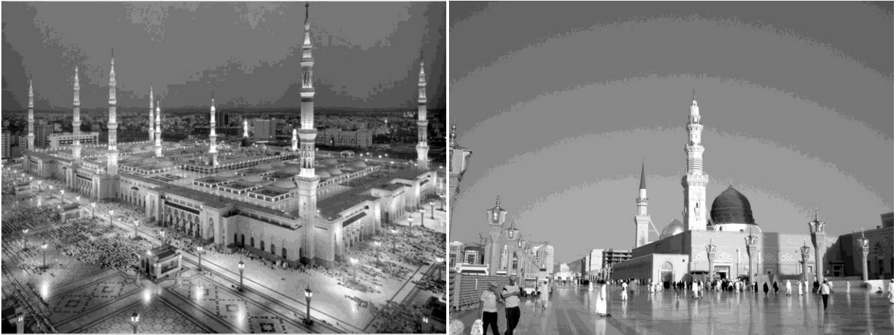
Рис. 1. Мечеть Масджид ан-Набаві в Медіні

багатство архітектури. За цим принципом організовані площі перед Собором Св. Петра у Римі (рис. 2а), Собором Святого Марка у Венеції (рис. 2б), Кафедральним собором у Мілані (рис. 2в), Собором Паризької Богоматері (рис. 2г) та ін.