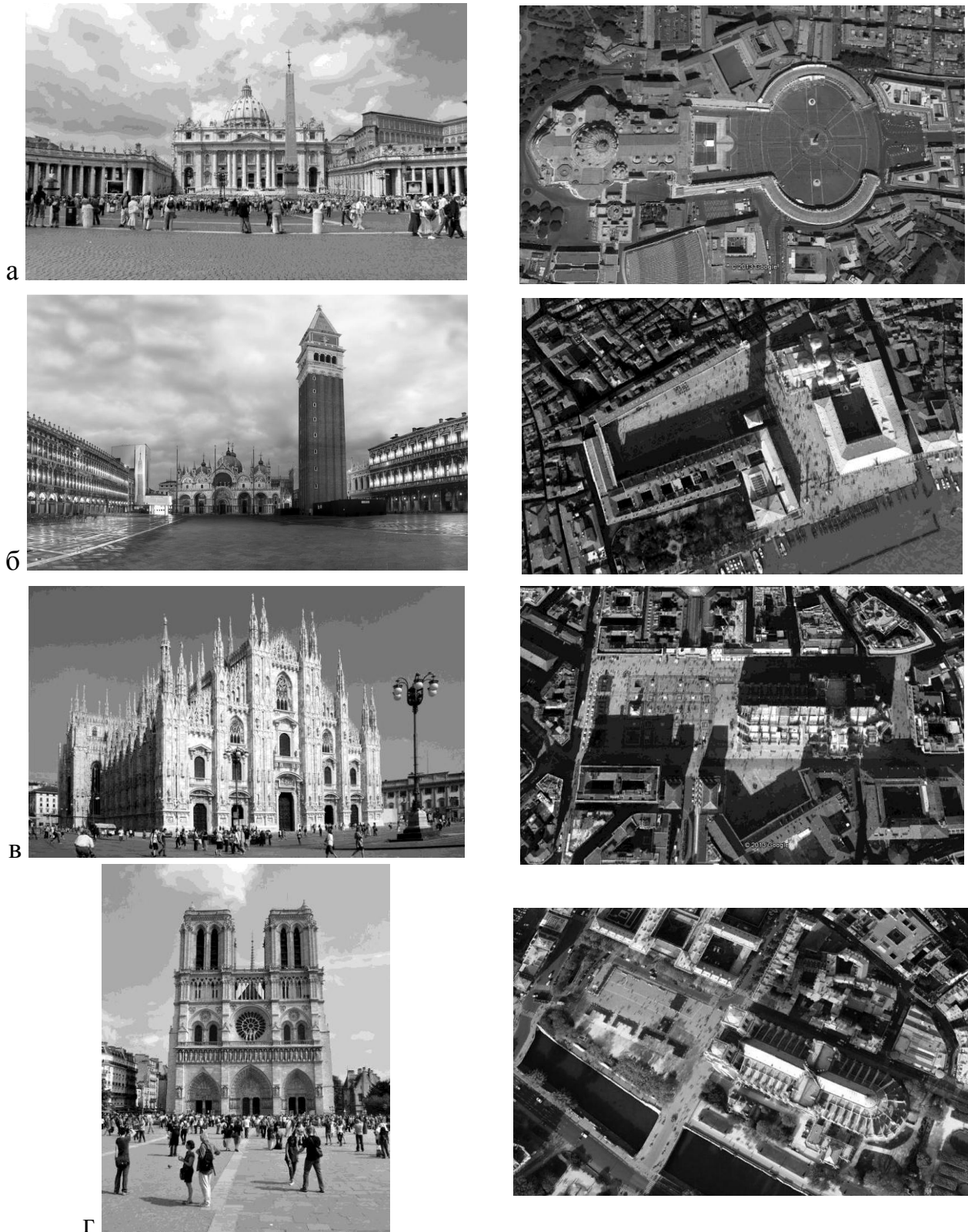
Рис. 2. Приклади влаштування площ перед сакральними спорудами: а – собор Святого Петра у Римі; б – собор Святого Марка у Венеції; в – кафедральний собор у Мілані; г – собор Паризької Богоматері.