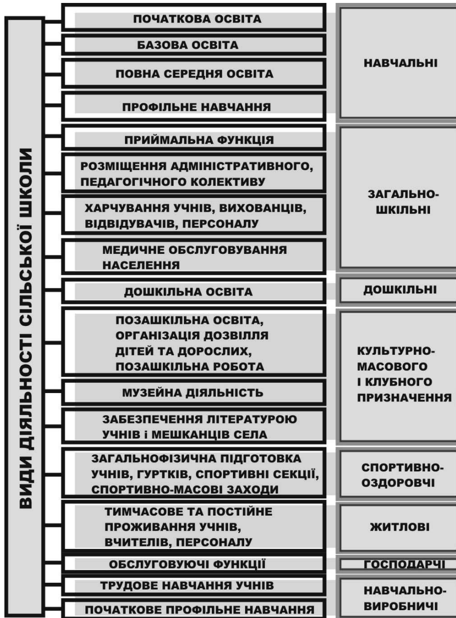
Рис.1 Види діяльності сільського загальноосвітнього навчального закладу