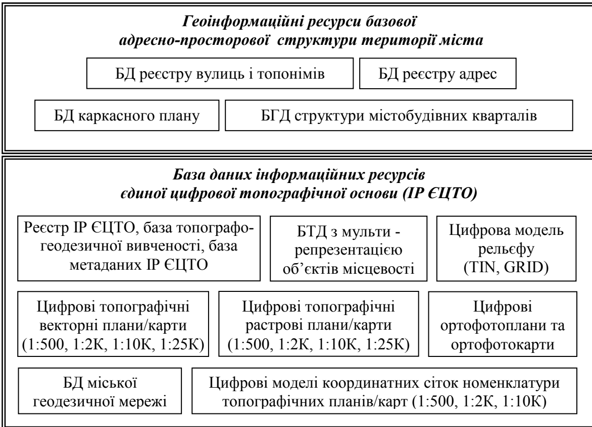
Рис. 1. Склад базових геоінформаційних ресурсів міста

Оскільки одним з основних принципів експлуатації ІР ЄЦТО є постійна їх актуалізація на основі оперативного оновлення змісту за результатами поточних інженерних вишукувань, кадастрових та виконавчих знімань, то такий підхід потребує формування бази даних інформаційних ресурсів в середовищі універсальної СКБД з відповідними реєстрами (рис. 2), зокрема: