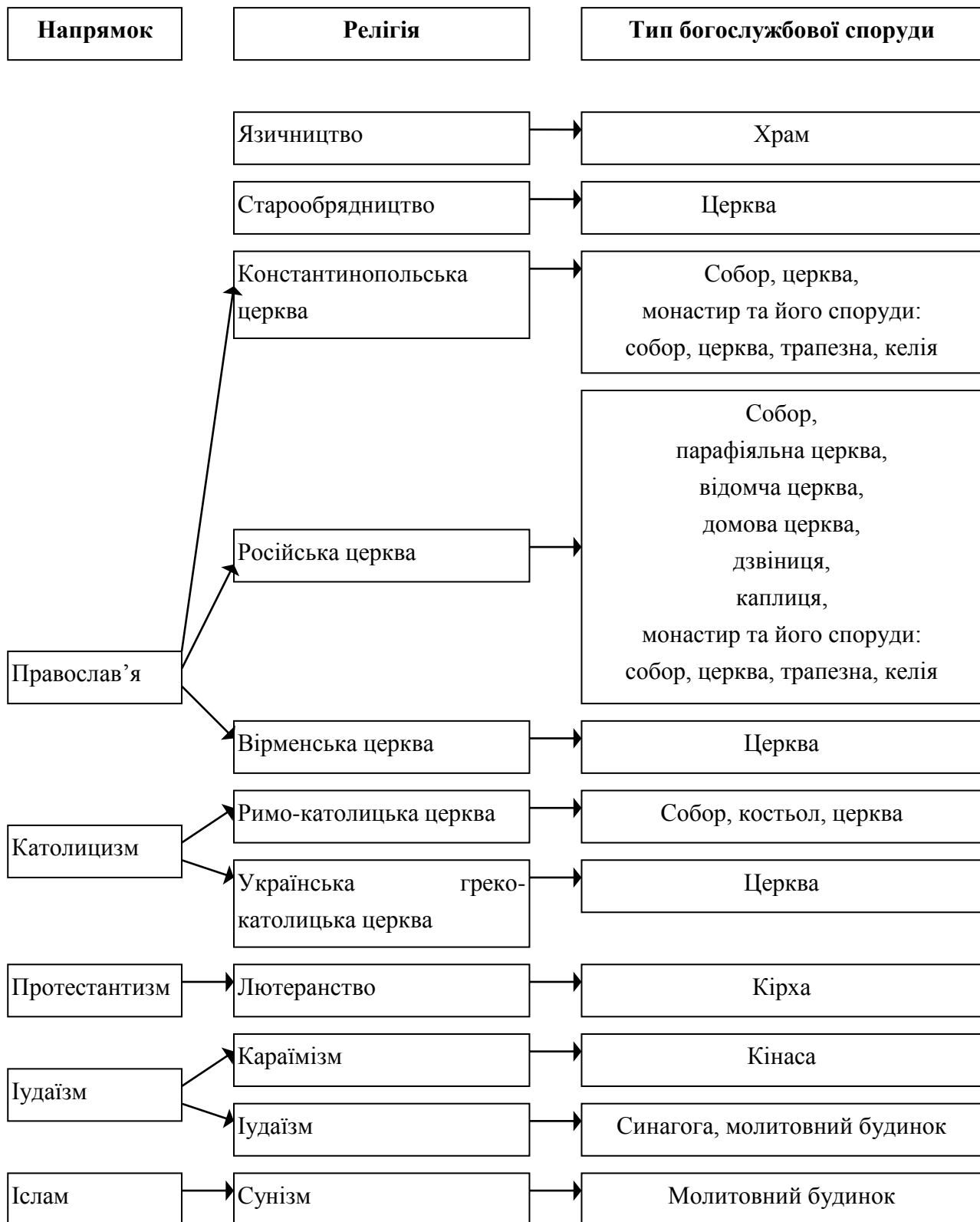
Рис. 2. Релігії, напрямки та типи богослужбових споруд історичного Києва.