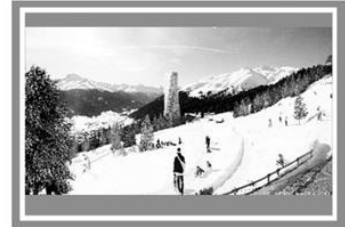
Готель «Шанцль-Тауер», Швейцарія, Давос