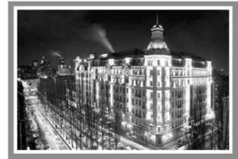
Готель «Прем'єр-Палас», Україна, Київ