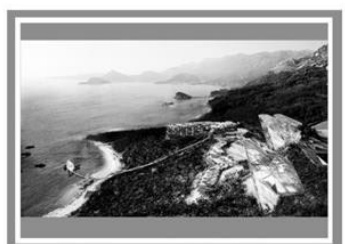
Готель «Монтенегро», Чорногорія