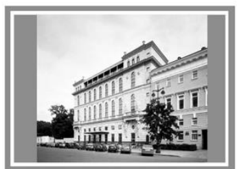
Готель «Островський», Росія, Санкт-Петербург