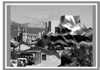
Готель «Маркес де Ріскаль», Іспанія