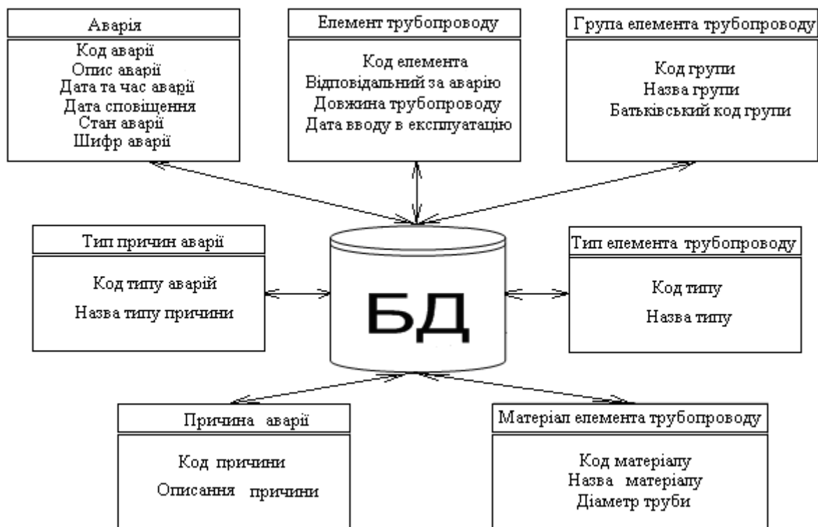
Рис. 2. Структурна схема бази даних.