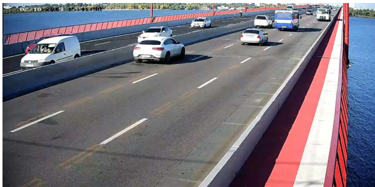
Рис. 3. Оглядний вид камери.

Порівняльний аналіз здійснено відносно базового способу підрахунку, яким встановлено ручний підрахунок в лабораторних умовах. Його суть полягає в тому, що обліковець, переглядає відео та вручну вносить відповідні позначки у раніше підготовлений бланк обліку. Для зручності обліку використовують умовні знаки [7]. Приклад бланку обліку наведено на Рис. 4[8].