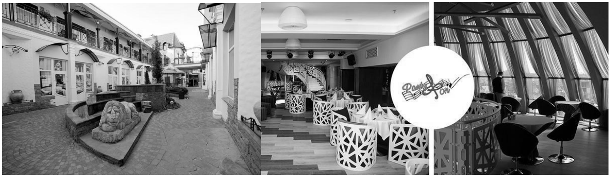
Рис. 7. Приклади використання елементів малої архітектури на ринках та в їх торгових закладах

Іншим типом є інформаційно-рекламні об'єкти. Розташовані вони в різних частинах ринків, але в основному при входах і на основних перетинах сполучень, а також при вході в більші торгові зали. Ринки добре освітлені перш за все вільно розташованими світильниками.