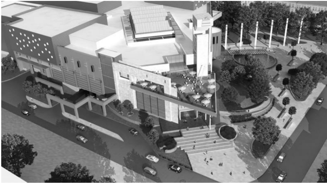
Рис. 6. Зовнішній вигляд торговельно-розважального центру "Форум. Львів"

в) Локалізація ринків серед інших видів громадського простору міста. Виходячи з того, що громадський простір міст традиційно ділиться на простір історичних центрів, комунікаційний, рекреаційний, нових житлових районів, а також нових торгових центрів, вважаємо простір ринків одним із його видів, який знаходиться у відповідних відносинах до інших видів, зокрема історичного центру та рекреаційного.