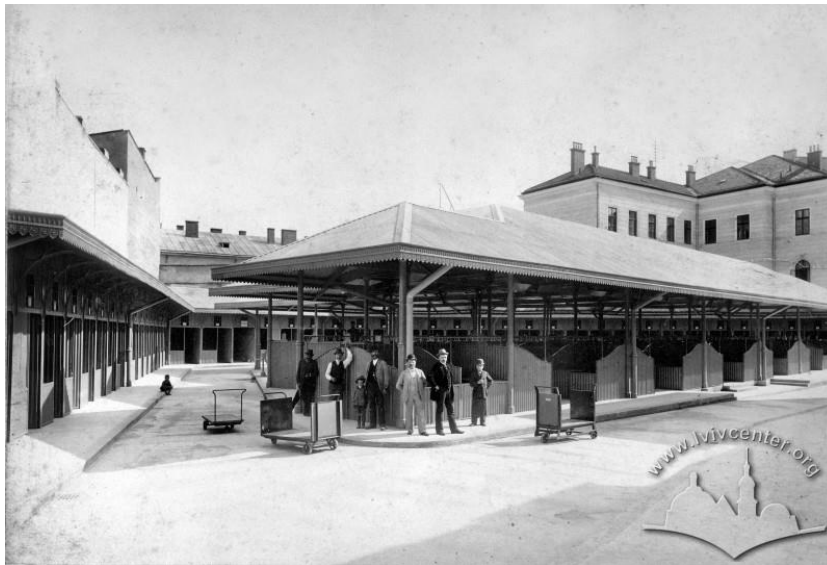
Рис. 1. Вигляд Галицького ринку більш ніж столітньої давності

Одним із найстаріших з існуючих у Львові вважається й Галицький ринок (рис. 1).