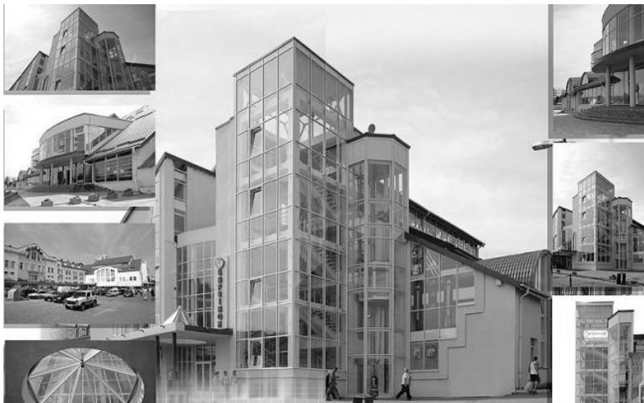
Рис. 4. Вигляд торгового комплексу в мікрорайоні "Сихів"

У мікрорайоні "Сихів" в останні роки споруджено торговий комплекс, основне призначення якого торговий центр, допоміжне — офісні приміщення, готель (рис. 4).