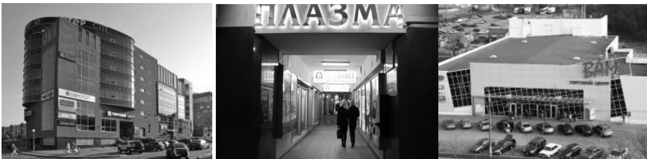
Рис. 5. Торгові центри, що функціонують у різних районах

б) Локалізація великих ринків у торговому просторі Львова. Торговий простір міста, окрім аналізованих нами ринків, творять великі торгові об'єкти, торгово-розважальні центри, а також малі ринки стихійної торгівлі. З початку ХХІ ст. у період розвитку сучасної торгівлі у Львові споруджено багато супермаркетів, а в останні роки — і торгових та торгово-розважальних центрів. Сьогодні у Львові налічується більше десятка великих торгових центрів, які складають конкуренцію традиційній ринковій торгівлі (рис. 5). Загалом у місті на 1 тис. мешканців припадає майже 300 м 2 поверхні торгових центрів та великих торгових об'єктів.