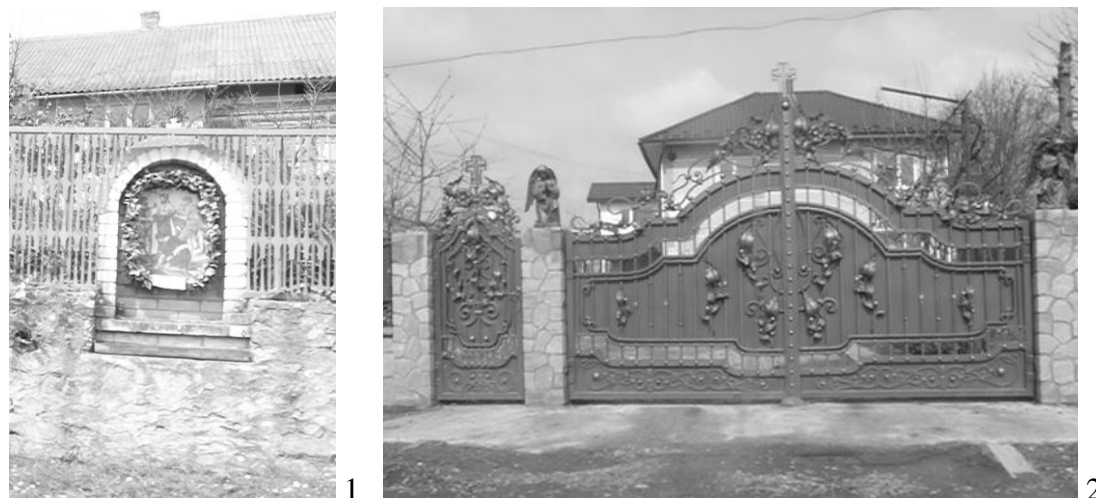
Рис. 7. 1. «Ікона» у структурі огорожі садиби, Тернопільська обл., 2. «ангели та хрести» як елементи оздоблення хвіртки та воріт, Чернівецька обл.

Дослідження, проведені на основі зібраних матеріалів під час експедицій у селах Західного регіону України, показали, що релігія має вплив на формування сучасної садибної житлової забудови. Проявом релігійності у структурі житлового будинку та присадибної ділянки є: