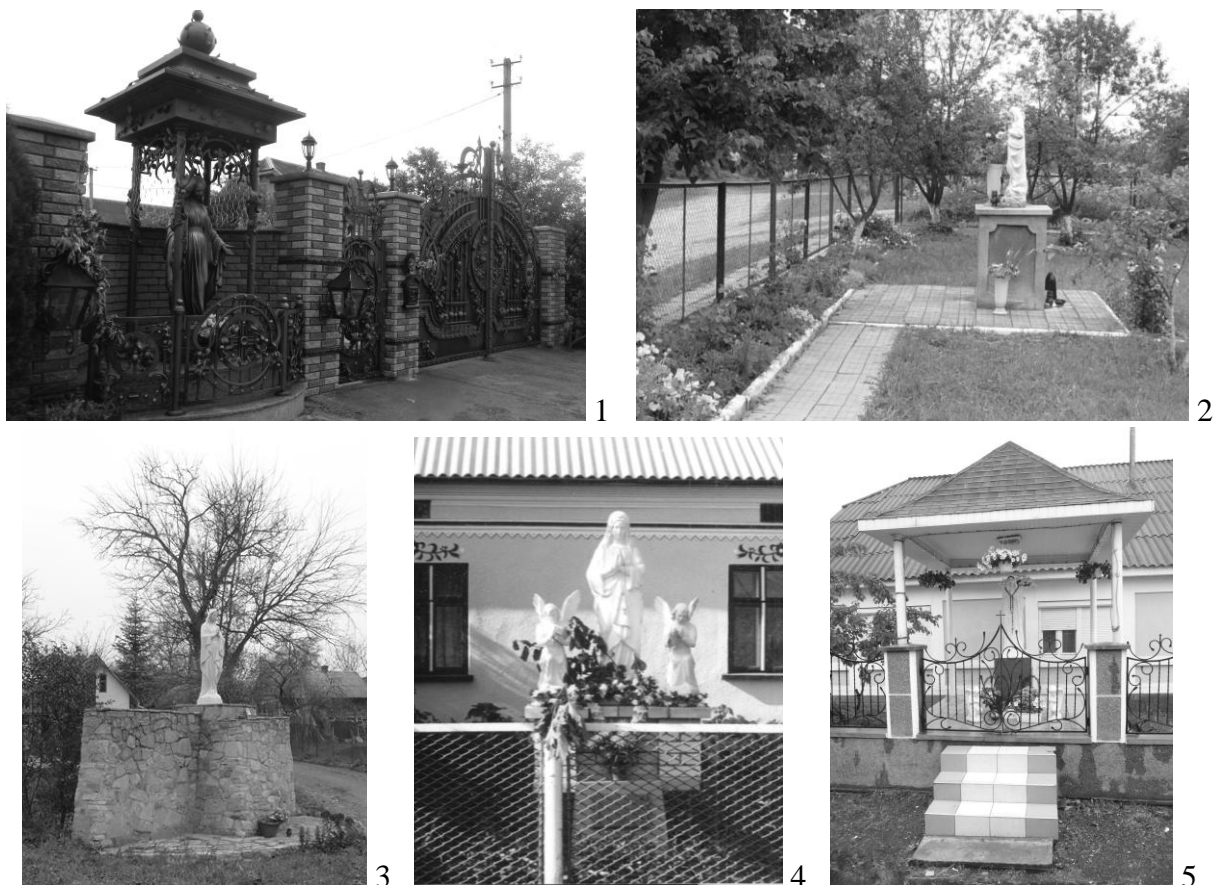
Рис. 5. «Фігури» у структурі садиби: 1. Івано-Франківська обл., 2. Львівська обл., 3. Чернівецька обл., 4. Тернопільська обл., 5. Закарпатська обл.

Оздоблення садиби елементами релігійної символіки відбувається досить стихійно і залежить від смаку та побажання господаря садиби. Сакральні