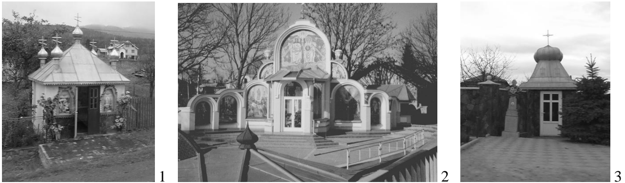
Рис. 4. «Каплички» у структурі садиби: 1. Івано-Франківська обл., 2. Тернопільська обл., 3. Чернівецька обл.

Останнім часом на садибній ділянці появляються нові форми – відновлюють колишні або зводять нові пам'ятні знаки релігійного характеру: хрести, скульптури («фігури») Матері Божої, ікони, невеликі приватні церкви, каплички для молитви, а в деяких випадках і каплички присвячені пам'яті померлих (рис. 4-7.1).