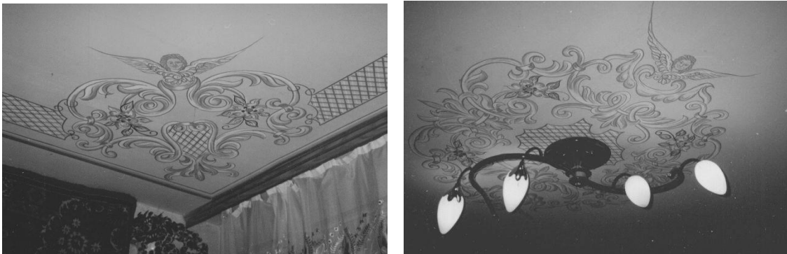
Рис. 2. Розписи стелі вітальні на релігійну тематику, Тернопільська обл.

У житлових кімнатах розписують стіни та стелі на релігійну тематику, обладнують спеціальні полички та встановлюють підставки для релігійної символіки (рис.2). Заможні власники осель організують окремі приміщення для молитви у структурі житлового будинку. На будинках часто влаштовують ніші для сакральної скульптури (рис.3).