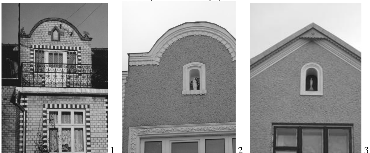
Рис. 3. Скульптура у ніші на фронтоні будинку: 1. Тернопільська обл., 2-3. Львівська обл.