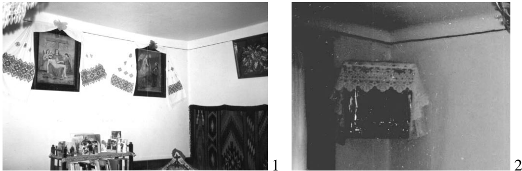
Рис. 1. 1. «Ікони», 2. «Божниця» на стіні у житловій кімнаті, Тернопільська обл. (світлини автора)

яка нагадує постійну Божу присутність в хаті. В інших кімнатах ікони теж розташовані на стінах чи по кутах. За звичаєм гість, заходячи до хати, перше схиляється перед іконами, а вже після промовляє до господаря [3,8].