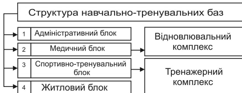
Рисунок 1. – Схема функціональної структури типової НТБ в Україні.

Спільним для всіх типів НТБ є наявність таких функціональних блоків: адміністративного, медичного, житлового, допоміжного, відновлювального (включає фізіотерапевтичний комплекс, відділення трансфузіології та еферентної терапії, SPA-блок, рис.1 і 2).