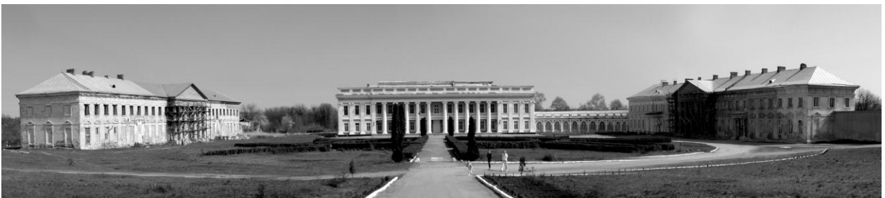
Рис. 4. Палац Потоцьких

Після переїзду Потоцького до Тульчина місто стало предметом великої турботи графа, який прагнув повернути йому колишнє значення. З цією метою він розширив свої маєтки, залишивши господарсько-адміністративним центром тільки тульчинський двір. Згодом був споруджений Тульчинський палац в 1782-му за проектом архітектора Лакруа як єдиний ансамбль, до складу якого входили, окрім головного палацу, два бічні флігелі, галереї (оранжереї), турецька лазня, театр, манеж, стайні, службові й житлові приміщення. Частина споруд садиби була звернена фасадами на вулицю, тобто входила в систему забудови міста. Споруда є однією з найцікавіших пам'яток періоду класицизму. Ансамбль оточував парк, що мав назву «Хороше», закладений у 1782 році за проектом архітектора П'єра Ленро.