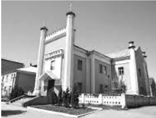
Рис. 8. костел Св. Станіслава.

Інтенсивно розвивалися кустарні промисли, було побудовано цукроварню, два шкіряні заводи, водяний млин, дві тютюнові фабрики, екіпажні майстерні. Протягом ХІХ ст. Тульчин зберігав статус одного з найбільших торгівельних центрів Південно-Західного краю. Споруджено ще один римсько-католицький костел в ім'я Св. Станіслава.