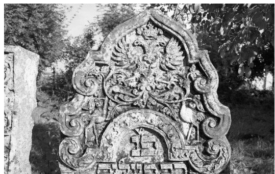
Рис. 2, 3. Старе єврейське кладовище.