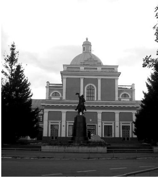
Рис. 5. Домініканський костел

1779 р. збудована Успенська церква, яка також орієнтована на палацовий комплекс Потоцького.