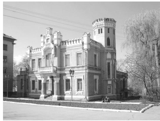
Рис. 9. Особняк Глікхера (1905р.)

П'ятий період містобудівного розвитку відбувається наприкінці ХІХ – початку ХХ ст. У Тульчині вже налічувалося близько 40 дрібних підприємств – цегельні, шкіряні й свічкові заводи, паровий і водяний млини, цукроварня, крупорушка, макаронна, тютюнова і каретна фабрики, вовночесалка, пивоварня і медоварня, завод штучних мінеральних вод. Місто мало понад чотириста невеликих крамниць, лавок, шинків, корчем. Діяли банківська і нотаріальна контори, готель, 12 заїжджих дворів.