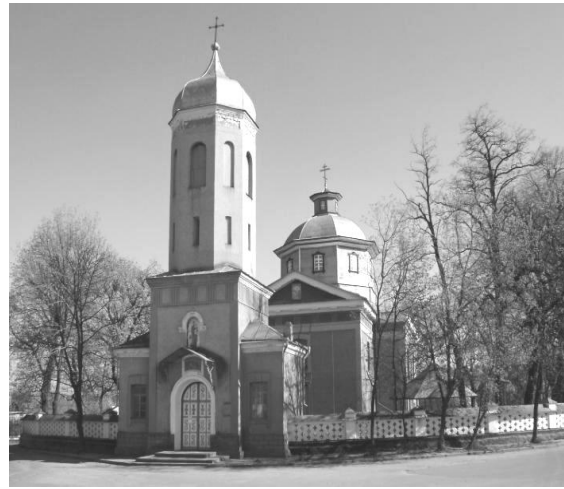
Рис. 6. Успенська церква

Третій період припадає на 1790-1830 рр. У 1793 Тульчин стає повітовим містом Брацлавського намісництва, з 1797 року – Подільської губернії. З 1796 року в ньому проживає командуючий Південно-Західною армією російський полководець О.В. Суворову Саме тут він написав знамениту працю «Наука перемагати». В 1818 р.-розпочато декабристський рух, полковник П.І. Пестель організує Тульчинську управу – філію «Союзу благоденства», яка проголошує себе Південним товариством. Основними архітектурними пам'ятками цього періоду стали: 1. Казарми 2-ої Російської кінної армії, 2. Будинок, в якому жив Пестель П.І. 3. Будинок дворянського зібрання (будинок «декабристів»).