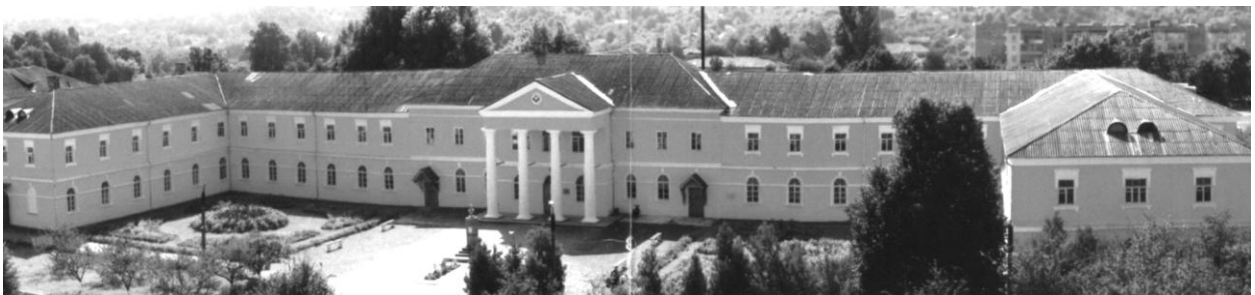
Рис.7. Казарми кінної армії (малий палац Потоцького)

Третій період припадає на 1790-1830 рр. У 1793 Тульчин стає повітовим містом Брацлавського намісництва, з 1797 року – Подільської губернії. З 1796 року в ньому проживає командуючий Південно-Західною армією російський полководець О.В. Суворову Саме тут він написав знамениту працю «Наука перемагати». В 1818 р.-розпочато декабристський рух, полковник П.І. Пестель організує Тульчинську управу – філію «Союзу благоденства», яка проголошує себе Південним товариством. Основними архітектурними пам'ятками цього періоду стали: 1. Казарми 2-ої Російської кінної армії, 2. Будинок, в якому жив Пестель П.І. 3. Будинок дворянського зібрання (будинок «декабристів»).