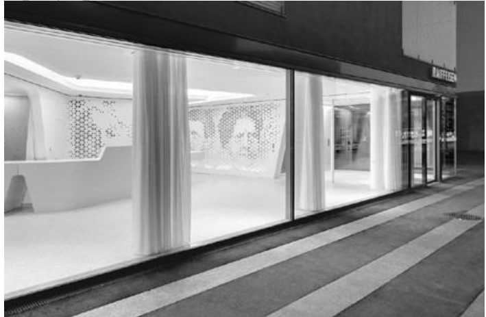
Рис. 3. Райффайзен Банк у Цюріху

Будівля Марокканського банку зовнішньої торгівлі (BMCE) - перший африканський проект відомої компанії Foster & Partners. Великі вікна, закриті ажурними ґратами з нержавіючої сталі з низьким вмістом заліза, - це не тільки ефектний елемент дизайну, але і вдале рішення для спекотного клімату. Так забезпечується широкий доступ денного світла, причому температура в приміщенні залишається комфортною (рис. 4).