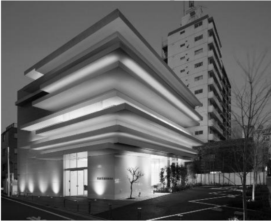
Рис. 2. Sugamo Шінкін банку в Токіо

каменем HI-MAX білого кольору, на які нанесені великі портрети знаменитих діячів мистецтва, які проживали в Цюріху (рис. 3).