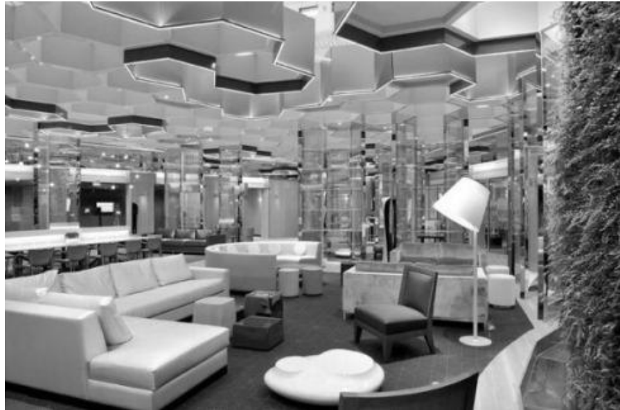
Рис. 1. Банк BNP Paribas у Парижі

Яскравий дизайн Sugamo Токіо Шінкін банку відповідає девізу компанії: «Ми отримуємо задоволення, обслуговуючи щасливих клієнтів» . Французький архітектор Еммануель Муру вирішив прикрасити фасад будівлі Дванадцяти різнокольоровими горизонтальні пластами різних розмірів (рис. 2), які всю ніч підсвічуються.