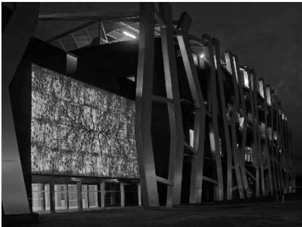
Рис. 6. Банк Vital в Іспанії

При роботі над будівлею банку Vital архітектори намагалися створити конструкцію, схожу на живий організм. Основний фасад будівлі виконаний з однотонного чорного скла. Однак його майже не видно за декоративним фасадом з нержавіючої сталі, елементи якого являють собою величезні макети парних хромосом. (рис. 6). Новий офіс Nordea в Копенгагені буде добудований до 2016 року і напевно стане однією з архітектурних пам'яток датської столиці. Об'єкт буде складатися з декількох будівель, загальна площа яких складе 40 тис. м 2 . Тут будуть трудитися близько 2 тис. співробітників (рис. 7).