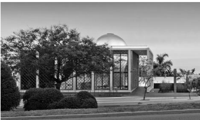
Рис. 4. Марокканський банк зовнішньої торгівлі (BMCE)

Дизайнер Роберт Майкут запропонував використовувати при оформленні РКО Bank Polski фірмові кольори цієї організації - чорний, білий і золотий. Концепція проекту полягає в тому, щоб поєднати естетичність з математичною точністю, подібно до того, як в роботі банку повинні поєднуватися життєвий досвід і правильний розрахунок (рис. 5).