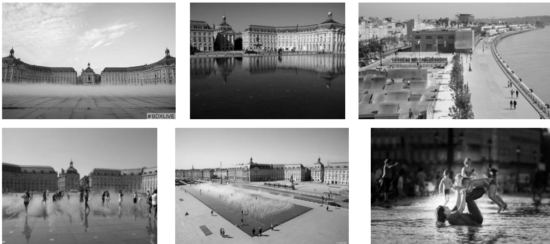
Рис. 2. Композиційний прийом поєднання статичної водної поверхні великої штучної водойми із динамічною формою водяних струменів у вигляді хмари на прирічкових територіях історичного міста: проект «Водне дзеркало» («Le miroir d'eau») для площі Place de la Bourse, Бордо (Bordeaux), Франція, 2006. Автор - архітектор Жан-Макс Ллорка (Jean-Max Llorca).

грацій. З 2006 року в передній частині площі, ближче до русла річки Гаронни (Garonne) було створено найбільше дзеркало води в світі «Le miroir d'eau» роботи архітектора Жан-Макс Ллорка (Jean-Max Llorca). Водна поверхня займає 3450 квадратних метрів. Гранітні плити вкрити тонким шаром води у 2 см. Палацовий комплекс велично відображається у водній поверхні, створюючи новий образ історичної забудови. У своєму проекті автор органічно поєднав дві форми води в рідкому стані: статичну та динамічну для створення більшого різноманіття та умов релаксації. Літом установка створює ефект туману через кожні 15 хвилин. Між дзеркалом води та історичною площею Place de la Bourse ще був створений «Сад Вогнів» («Jardin des Lumières»). Сьогодні набережні Гаронни є улюбленим місцем відпочинку та прогулянок мешканців та гостей міста, де можна відпочити, освіжитися, навидь побавитися у водяному пилу. «Водне дзеркало» відображає як дружелюбну особистість міста, так і його відкритість до світу. В даному випадку це приклад вдалого поєднання статичної водної поверхні великої штучної водойми із пароподібною хмарою на прирічкових територіях історичного міста.