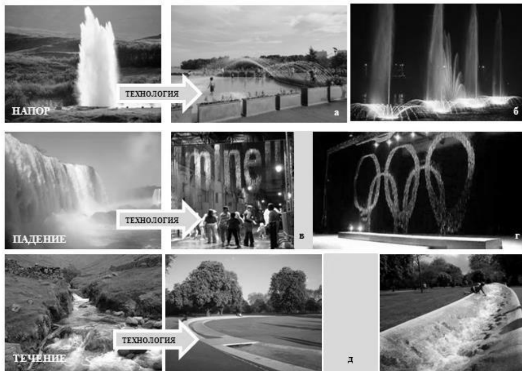
Рис. 1. Форми динамічного стану водного компоненту ландшафту: а - зона набережної р. Потомак, ДжорджТаун, м. Вашингтон ДС, США, 2011 (фото Рубан Л.І.); б - мультимедійні фонтани у м. Вінниці, Україна, 2011 (фото Рубан Л.І.); в, г - технологія Акваскрінт (The AquaScript), виставка Tokyo Bay Monster-fashion show, Джуліус Поп, Токіо, Японія, 2007; (Фото J. Popp); д - Меморіальний фонтан пам'яті Діани, принцеси Уельської, Хайд парк, Лондон, Великобританія, 2003-04 рр. (Фото Рубан Л.І. та із офіційного сайту).

Відносно природних водних об'єктів та їх прибережних територій потрібно виділити наступні композиційні прийоми та заходи архітектурно-ландшафтної організації.