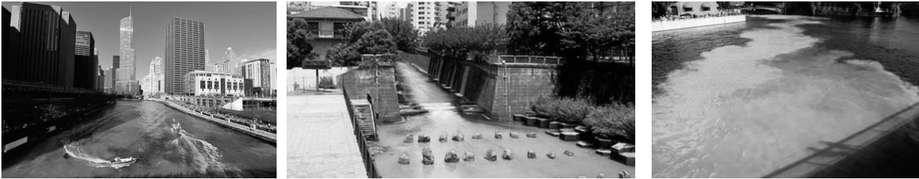
Рис. 5. Прийом використання природних водойм як композиційних елементів еколого - середовищних інсталяційних робіт: проект Зелена Ріка (Green River), 1998-2001. The Northern Fjallabak Route, Iceland, 1998; Bremen, Germany, 1998; Moss, Norway, 1998; Los Angeles, USA, 1999; Stockholm, Sweden, 2000; Tokyo, Japan, 2001. Автор: Олафур Еліасон (Olafur Eliasson).

міста сучасності. В Європі – це Більбао, Мадрид, Валенсія, Париж, Вена, Берлін, Лондон та ін., в Азії - Сінгапур, Шанхаї та ін., на американському континенті – Нью Йорк, Торонто та ін.