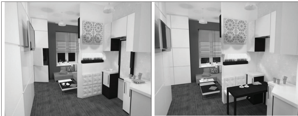
Рис.1 Приклад розмежування житлового простору за допомогою площинних перегородок

Інший вид варіантного планування можна отримати за допомогою площинних перегородок у вигляді щитів різних конструкцій, що встановлюються в пази верхніх і нижніх направляючих елементів.[2] Якщо в таких стінових елементах, а точніше в меблевих щитах, передбачені закладні вертикальні профілі, то це забезпечує вертикальне навішування окремих виробів корпусних меблів з однієї або двох сторін (Рис.1).