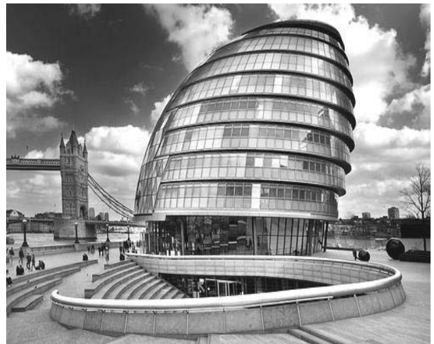
Рис. 3. Лондон. Муніципалітет «City Hall, London», Н. Фостер, 1998-2002 рр.