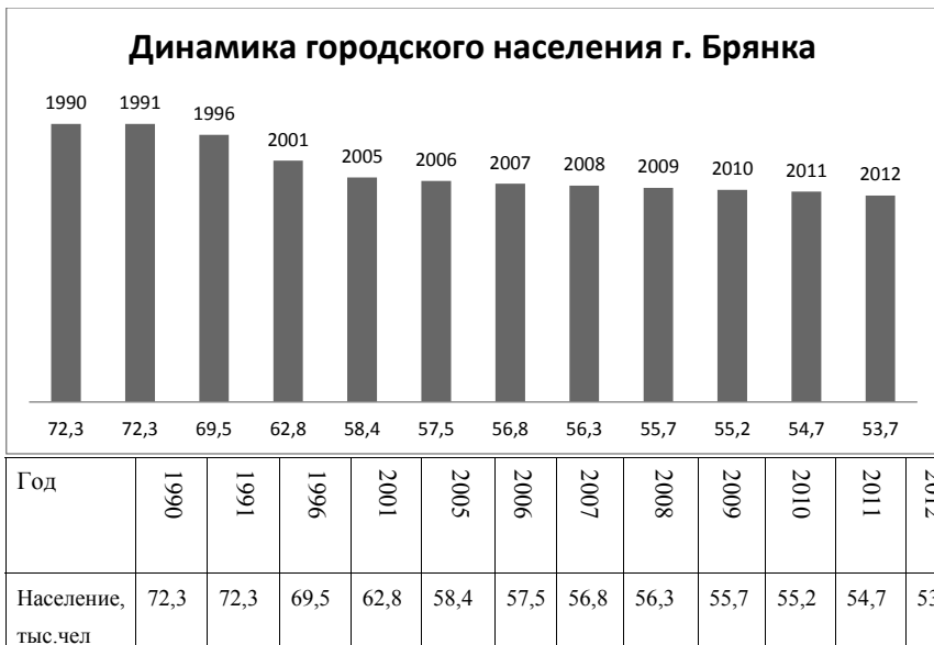
График динамики городского населения города Брянка за период 1990 – 2012 г.г.

Город Брянка - это монопроизводственный угледобывающий город, в котором до 1996 г. работало 12 шахт, из которых к 2013 году осталось 2 – Вергелевская и Ломоватская. В целом, численность рабочих занятых в угольной промышленности сократилась к 2013 г. более чем на 18%, а производительность и условия труда остаются низкими в сравнении с показателями Европы и США.