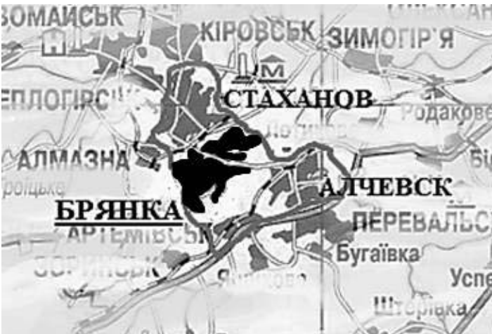
Рис. 2 Территориальное размещение города Брянка в составе ЦЛА.

Город Брянка входит в состав ЦЛА, находится между Алчевском и Стахановом, образуя с ними фактически единое целое (Рис. 2).