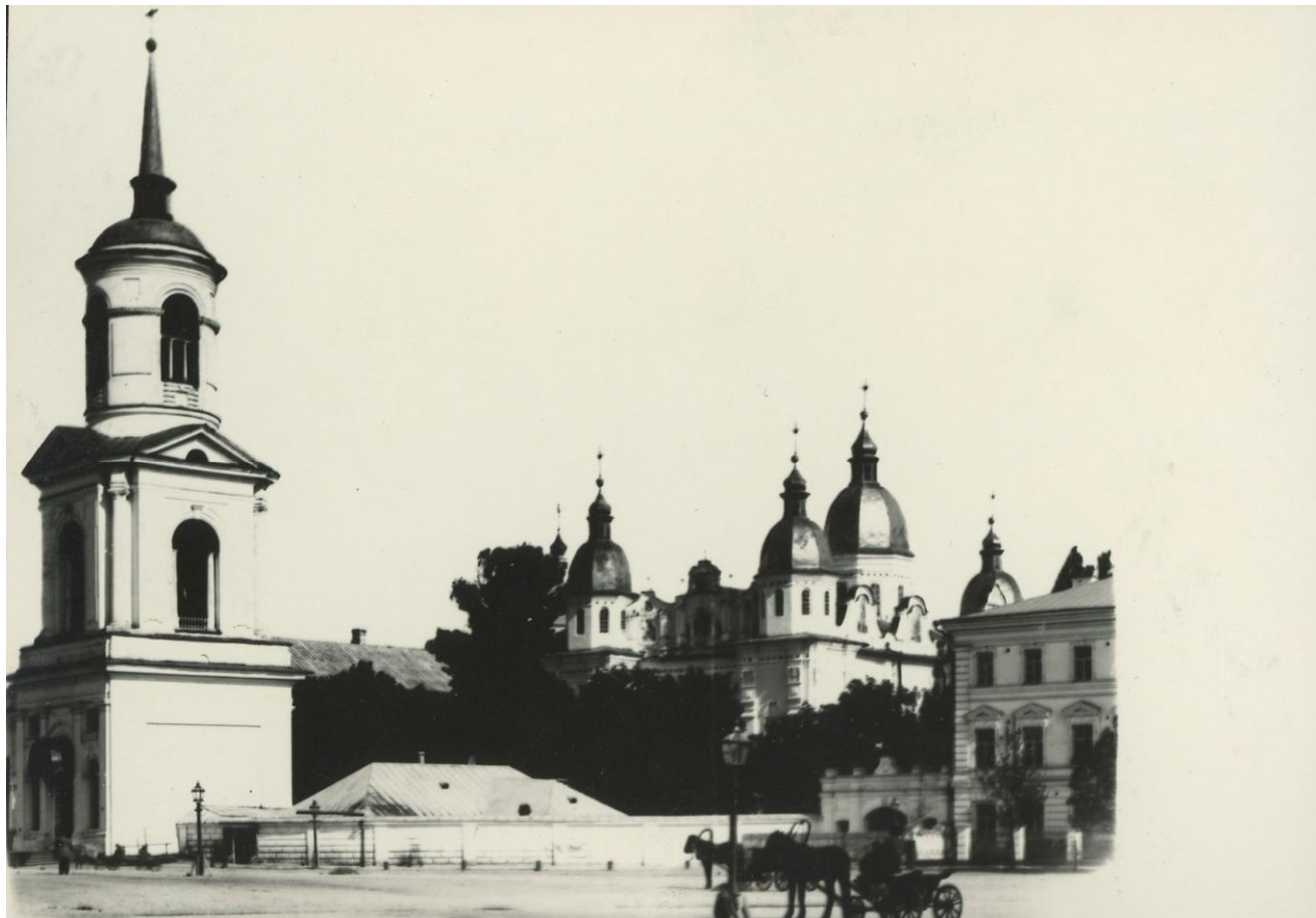
Рис. 1. Богоявленський Братський монастир на Подолі в Києві (архівне фото з фондів Ю.В. Івашко).

Архітектура України представлена різними стилями, які відображали або національне спрямування (народна архітектура, архітектури доби Гетьманщини на землях Правобережної Наддніпрянщини і Лівобережжя (рис.1, 2), український національний романтизм початку ХХ століття), або підпорядковувались загальноєвропейським тенденціям (архітектура доби Середньовіччя, Ренесансу, історизму-еклектизму, модерну), або виражали імперські традиції (класицизм і ампір кінця ХVІІІ – І половини ХХ століття, т.зв. псевдоруський та русько-візантійський стилі ІІ пол. ХІХ-початку ХХ століття).