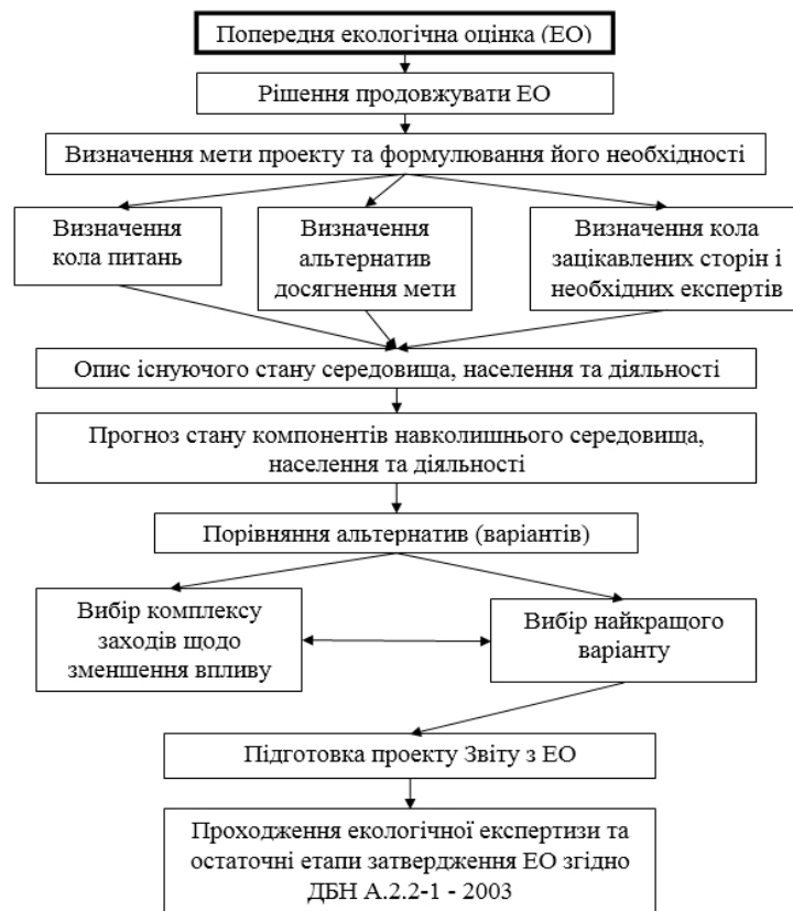
Рис. 1. Процедура проведення екологічної оцінки

При розробці схем перспективного розвитку, розміщенні, проектуванні, будівництві і введенні в експлуатацію нових вузлів в системі ВДМ міста і реконструкції існуючих, необхідно забезпечити екологічну безпеку навколишнього міського середовища. Іноді екологічні аспекти стають визначними для створіння архітектурного чи містобудівного об'єкта включаючи дорожньо-транспортні споруди.