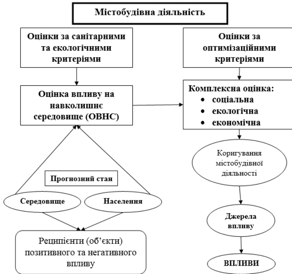
Рис. 3. Схема екологічної оцінки стану НС (ОВНС) в структурі процесу містобудівної діяльності

Наука про містобудівну діяльність є в значній мірі синтетичною, бо вона відповідає на соціальні, економічні, технологічні, екологічні та інші питання. Екологічна оцінка впливу містобудівної діяльності на населення та навколишнє міське середовище є фактично процесом систематичного аналізу та оцінки екологічних наслідків взаємодії управлінських рішень в галузі нормалізації еколого-соціального стану міського середовища.