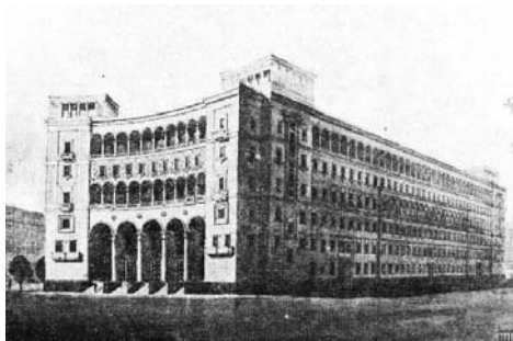
Іл. 4. Проект готелю. Реконструкція Присутствених місць. 1938 р. Арх. В.Г. Заболотний, Г.О. Миронович, Н.Б. Чмутіна, та Г.І. Граужис