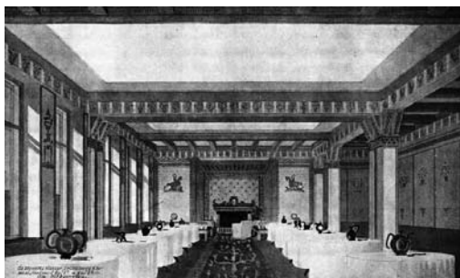
Іл. 2. Проект реконструкції ресторану готелю «Червоний Київ». 1936 р. Арх. П. Г. Юрченко.

Можна впевнено твердити, що на початок 1940 року жоден з вищеназваних готелів даної групи (окрім готелю «Континенталь») не був відремонтований повністю, згідно з означеними планами та не відповідав сучасним вимогам за рівнем комфорту й устаткування, що суттєво впливало на кількість комфортного номерного фонду та належне обслуговування приїжджих.