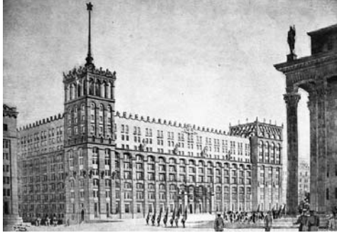
Лл. 6. Проект готелю на 500 місць. 1940 р. Арх. Г.О. Благодатний, А.В. Добровольський, М.В. Холостенко, О.М. Смик та проф. М.О. Шехонін

Головним містобудівним чинником таких змін став пошук ділянок, який передбачав залучення додаткових міських районів для спорудження нових готелів. Таким чином, в період між 1936 та 1940 роками, відбулося поступове