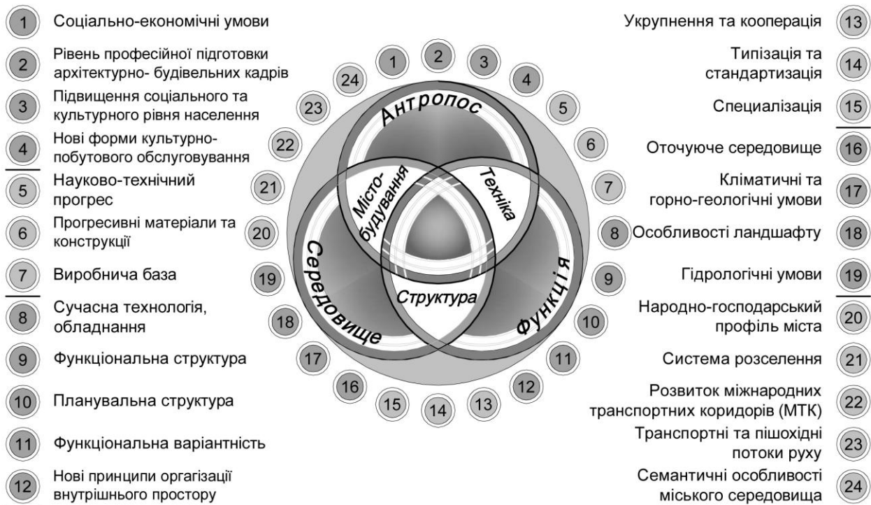
Рис.1 . Тріада чинників формування архітектурних систем та об'єктів.

містобудівні, функціонально-технологічні, конструктивні, екологічні, образно-символічні фактори та фактор системи морського транспорту (див. рис.2).