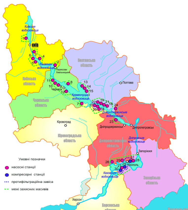
Рис.1. Загальні характеристики захисного комплексу р.Дніпро

Але підвищення рівня води, яке відбулося під час створення Дніпровських водосховищ, призвело до підтоплення і затоплення великої території. Для захисту населених пунктів, промислових підприємств та територій у межах впливу Дніпровських водосховищ створено захисний комплекс (рис.1).