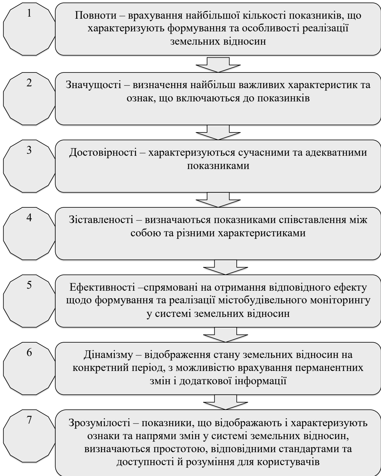
Рис. 1. Критерії якості багатоцільового кадастру для забезпечення містобудівного моніторингу формування та використання земель міст (розроблено автором)

містобудівного моніторингу формування та використання земель міст запропоновано використовувати критерії якості, які створюють єдину систему (рис. 1.).