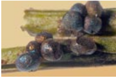
15. Lamproderma cacographicum , © A. M.