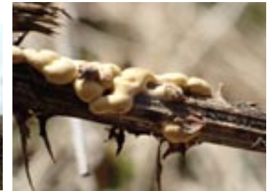
38. Physarum alpestre , © G. D.