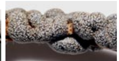
28. Lepidoderma chailletii , © A. M.