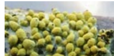
39. Physarum alpinum