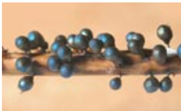
21. Lamproderma piriforme , © A. M.