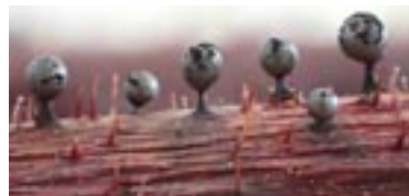
36. Meriderma spinulosporum