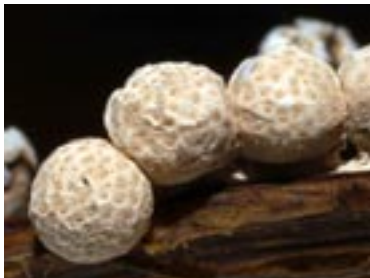
5. Diderma fallax , © A. M.