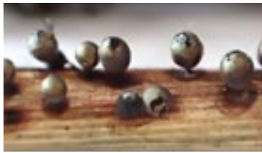
19. Lamproderma ovoideopulchellum , © A. M.