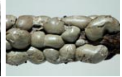
26. Lepidoderma aggregatum , © A. M.