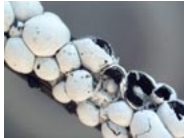
4. Diderma europaeum