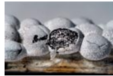
41. Physarum vernum