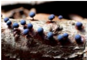
22. Lamproderma pulveratum , © A. M.