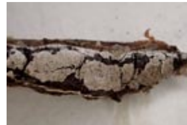
29. Lepidoderma granuliferum , © A. M.