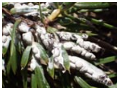
Juniperus communis hébergeant Diderma alpinum