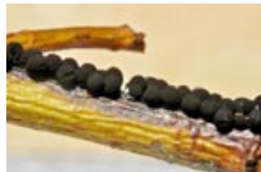
34. Meriderma echinulatum , © B. Woerly