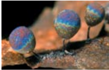
20. Lamproderma ovoideum