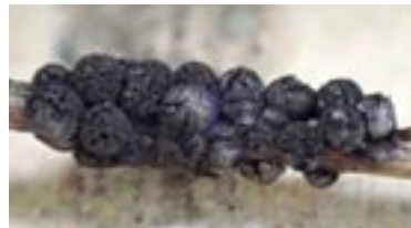
32. Meriderma carestiae , © B. Woerly