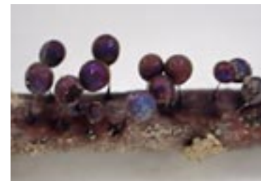
13. Lamproderma arcyrrioides