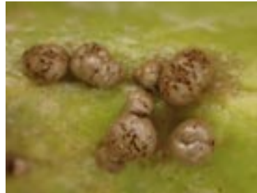
2. Dianema subretisporum