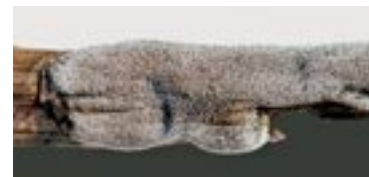
27. Lepidoderma carestianum , © A. M.