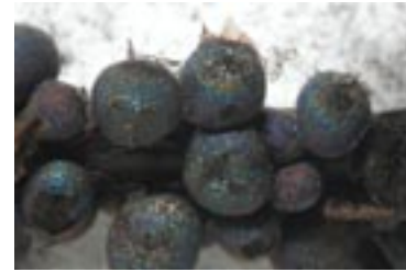
25. Lamproderma sp., © A. M.