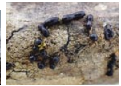
42. Trichia alpina , © A. M.