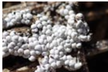
6. Diderma meyerae , © G. D.