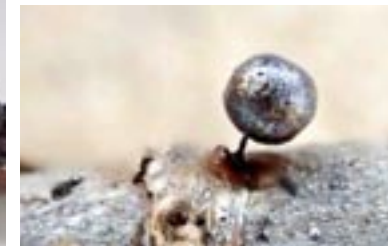
14. Lamproderma argenteobrunneum