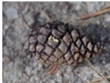
Cône de Pinus uncinata et Physarum alpestre

De nombreuses ptéridophytes montagnardes abritent des myxomycètes nivicoles, sur le pétiole, les pennes et les pinnules, couchés sur le sol, aplatis par le poids de la neige hivernale: Equisetum hyemale L., Dryopteris filix-mas (L.) Schott, Dryopteris oreades Fomin., Polystichum lonchitis (L.) Roth, Polystichum aculeatum (L.) Roth, Polystichum setiferum (Forssk.) Woinar. Sur les feuillus, on examinera les branches de Sambucus nigra L., Sorbus aucuparia L., Fagus sylvatica L., Betula pubescens Erhart, Salix purpurea L., et Calluna vulgaris (L.) Hull. L'examen minutieux (et fastidieux!) de milliers de feuilles, sur les deux faces, de Rhododendron ferrugineum L., peut être récompensé par la trouvaille d'un myxomycète rare et minuscule.