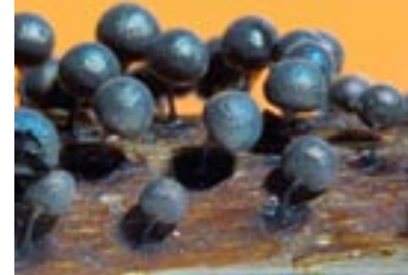
23. Lamproderma sauteri

30 - Lepidoderma peyerimhoffii Maire & Pinois