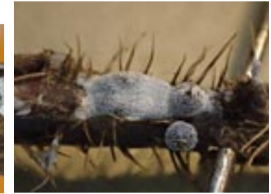
10. Didymium pseudodecapiens , © A. M.

11 - Lamproderma aeneum Mar. Mey. & Poulain