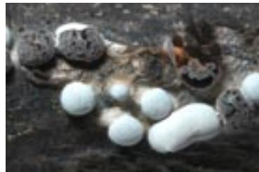
8. Diderma niveum , © A. M.