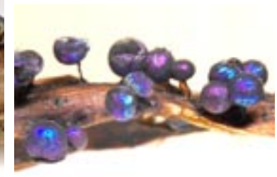
12. Lamproderma album , © A. M.