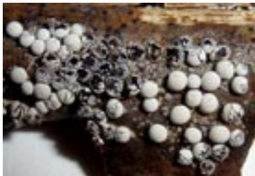
7. Diderma microcarpum , © A. M.