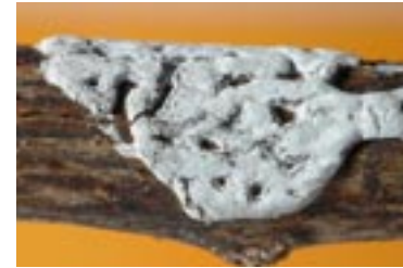
9. Didymium dubium