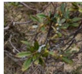
Diderma sur feuilles de Rhododendron

Calluna vulgaris (L.) Hull, Athyrium filix femina (L.) Roth, Betula pubescens Ehrhart., Heracleum pyrenaicum Lam., Juniperus communis L. Nous avons observé des myxomycètes nivicoles sur Fagus sylvatica L., sur des débris de: Festuca eskia Ramond, Pinus uncinata Ramond, Rubus serpens Weihe, Sambucus nigra L., Achillea millefolium L., Galeopsis tetrahit L., Dryopteris filix-mas (L.) Schott, Plantago alpina L. À noter deux espèces trouvées sur cailloux, une sur tronc pourri et une sur mousse. Des myxomycètes nivicoles ont été précédemment prélevés sur Carduus carlinoides Gouan, Carduus defloratus L., Daphne laureola L., Erica vagans L., Festuca rubra L., Heracleum sphondylium L., Hypericum maculatum Crantz, Nardus stricta L., Salix reticulata L., Thymus pulegioides L. À l'avenir la prospection des étages alpin et cryonival permettra d'élargir cette liste préliminaire.