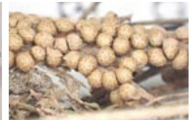
30. Lepidoderma peyerimhoffii , © A. M.