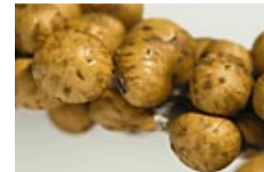
43. Trichia sordida , © A. M.