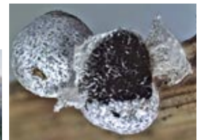
40. Physarum nivale , © G. Manavella