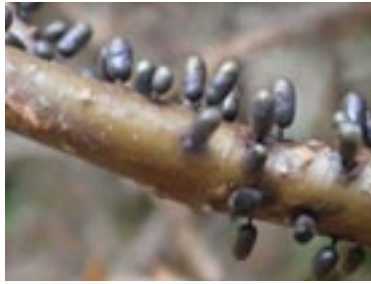
16. Lamproderma cucumer