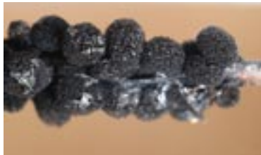
31. Meriderma aggregatum , © A. M.