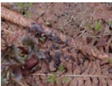
Lamproderma sur pétiole et pinnules d'un Athyrium , © G. D.

Lors des recherches, en avril 2018, les débris de végétaux très divers, les herbes sèches aplatis par la neige hivernale, offrent le plus fort contingent de découvertes (vingt deux espèces soit 1/5). Sur Rhododendron ferrugineum L. (15 sp. 13 %), Salix purpurea L. (9 sp.), Vaccinium myrtillus L. (8 sp.) à colonisation très fréquente, peut héberger des espèces rares et Rubus idaeus (8 sp.). Avec une moindre diversité d'espèces sur