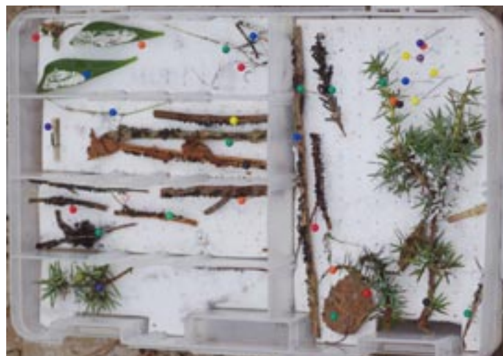
Boîte de récolte remplie de myxomycètes nivicoles, avant la mise en herbier et leur étude