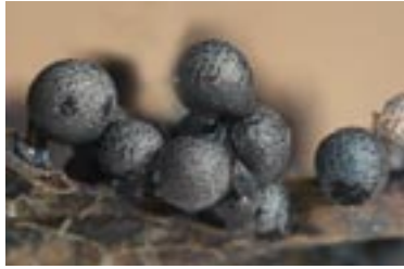
17. Lamproderma echinosporum , © A. M.