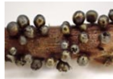
11. Lamproderma aeneum , © A. M.

22* - Lamproderma pulveratum Mar. Mey. & Poulain