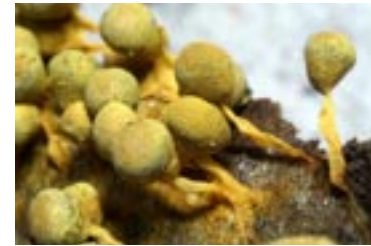
37. Physarum albescens