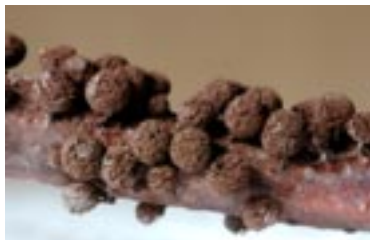
35. Meriderma fuscatum , © A. M.