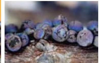
24. Lamproderma spinulosporum , © A. M.