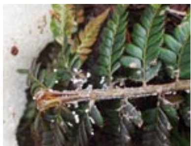
Sur pétiole et pinnules de Polystichum setiferum

De nombreuses ptéridophytes montagnardes abritent des myxomycètes nivicoles, sur le pétiole, les pennes et les pinnules, couchés sur le sol, aplatis par le poids de la neige hivernale: Equisetum hyemale L., Dryopteris filix-mas (L.) Schott, Dryopteris oreades Fomin., Polystichum lonchitis (L.) Roth, Polystichum aculeatum (L.) Roth, Polystichum setiferum (Forssk.) Woinar. Sur les feuillus, on examinera les branches de Sambucus nigra L., Sorbus aucuparia L., Fagus sylvatica L., Betula pubescens Erhart, Salix purpurea L., et Calluna vulgaris (L.) Hull. L'examen minutieux (et fastidieux!) de milliers de feuilles, sur les deux faces, de Rhododendron ferrugineum L., peut être récompensé par la trouvaille d'un myxomycète rare et minuscule.