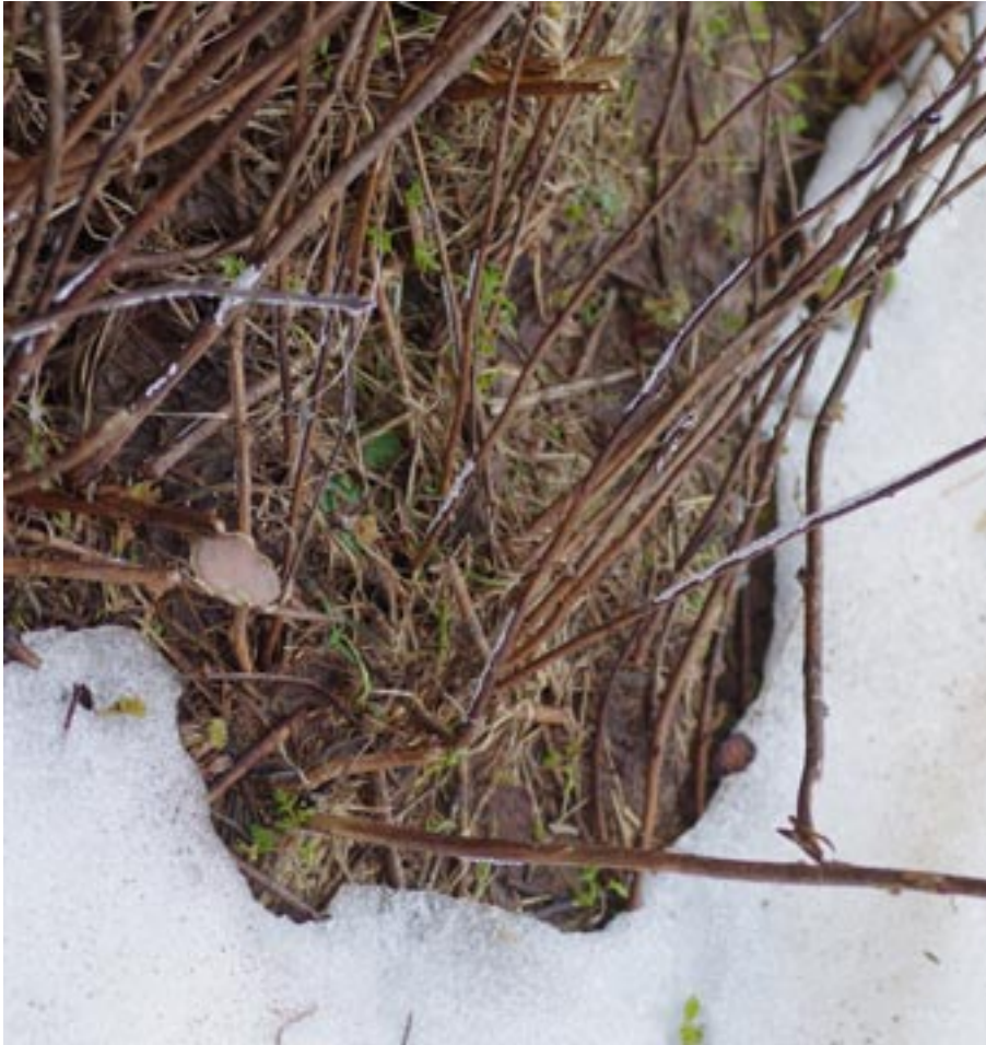
Sur la montagne pyrénéenne en avril, des êtres minuscules et éphémères font leur apparition au bord de la neige fondante : les étranges myxomycètes nivicoles

PAR G. DUSSAUSSOIS - A. MICHAUD - T.I. KRYVOMAZ