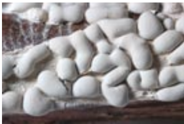
3. Diderma alpinum , © A. M.