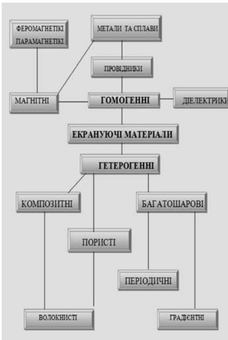
Рис. 2 Класифікація захисних матеріалів для екранування електромагнітних полів та випромінювань

Крім розгляду властивостей захисних матеріалів необхідно надати їх класифікацію (рис.2). Значну частину знань з електромагнітної безпеки, а саме – практичного спрямування, студенти повинні отримувати при вивченні дисциплін безпеки життєдіяльності та охорона праці (охорона праці в галузі). Окремі теми можуть розглядатися на різних курсах навчання, в залежності від спеціальності студентів. Необхідним є надання інформації та заходів безпеки при роботі з персональними комп'ютерами типу Notebook, які зазвичай вважаються абсолютно безпечними. Їх небезпечність обумовлена накопиченням електростатичних зарядів на полімерних поверхнях, які негативно впливають на якість повітря безпосередньо у зоні дихання.