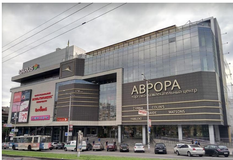
Рис. 1. Общий вид ТРЦ «Аврора»

Для наглядности рассмотрим данный вопрос на реальном объекте. В 2012-2013 гг. специалистами ЗАО НИИСК велись работы по научному сопровождению возводимого ТРЦ «Аврора» (общий вид приведен на рис. 1). Целесообразность работы была вызвана изменением действующих нагрузок, корректировке математической модели здания. Данные изменения необходимо было внести по требованию заказчика (владельца объекта строительства). Изменение нагрузок проявилось на участках перекрытий первого и шестом этажах здания, превысив проектные значения более чем в два раза. Помимо этого, на шестом этаже разместили кинотеатры (ранее в проекте не были предусмотрены) для чего были дополнительно установлены наклонные металлические балки. На период внесения данных изменений каркас здания со всеми несущими элементами в т.ч. покрытием и крышей был возведен, не были выполнены только отделочные работы и работы по устройству эскалаторов и лифтов. Все это привело к изменению работы здания.