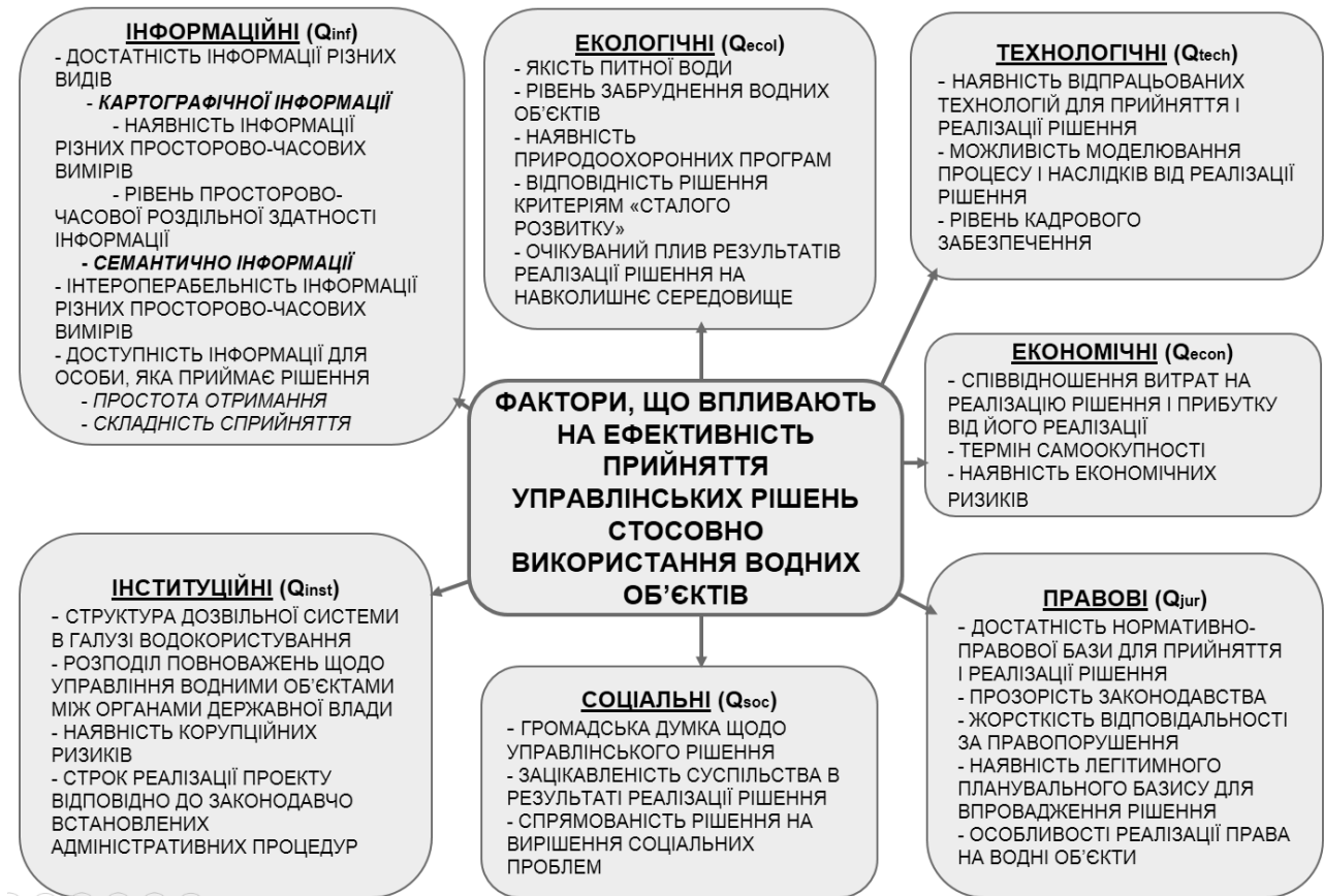
Рис. 1. Фактори, що впливають на ефективність прийняття управлінських рішень стосовно використання водних об'єктів

В сучасних умовах екологізації суспільства, важко переоцінити вагомість екологічних факторів Q_{ecol} при використанні водних об'єктів. Враховуючи багатofункціональність водних об'єктів, стає очевидним необхідність врахування наслідків від прийнятих рішень на якість питної вод, рівень забруднення водних об'єктів та будь-який інший очікуваний вплив на навколишнє середовище. При цьому важливими важелями є природоохоронні програми що спрямовані на дотримання критеріїв «сталого розвитку».