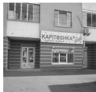
Дитячий клуб «Капітошка»