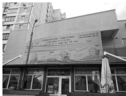
Клуб дитячої творчості «Ухтишка»