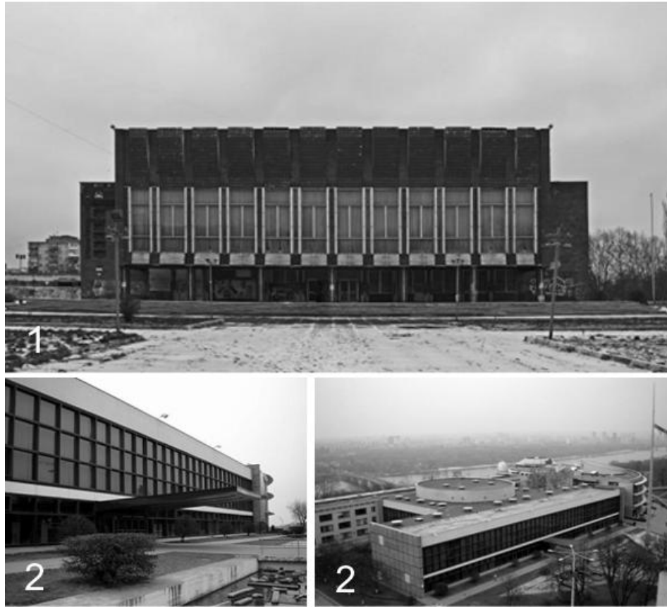
Рис. 1. 1 - Палац культури ім. Королева; 2- Київський Палац дітей та юнацтва.

У радянському минулому України система позашкільної освіти була сформована і чітко структурована за чисельністю учнів, типам і профілів установ, характерам дозвілля і т.д. і охоплювала всю соціальну сферу суспільства. [2].