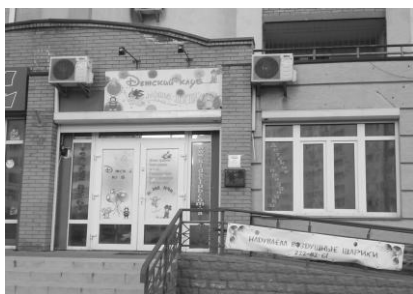
Дитячий клуб «Свято дитинства»

установ вдаються до «дешевих» методів реклами, яка аж ніяк не підпорядковується з місцевістю (рис. 2).