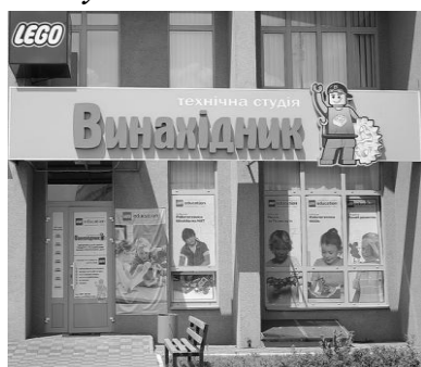
Технічна студія «Винахідник»