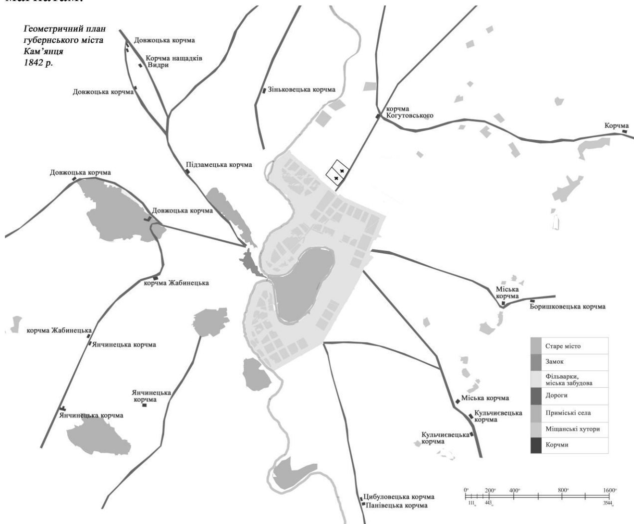
Рис. 1. Геометричний план губернського м. Кам'янець-Подільського 1842 р. з 21-ю корчмою на передмістях.

Для туристичного огляду можна запропонувати два старовинних парки з деревами місцевих порід, три музеї (історико-краєзнавчий музей, музей історії суконної фабрики, музей історії освіти Дунаєвеччини), палац Красінських, який в різні часи належав Потоцьким, Станіславським, Конєцпольським та іншим магнатам.