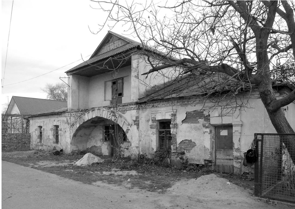
Рис. 2. м. Старокостянтинів. Збережений заїзд кінця XVIII ст.