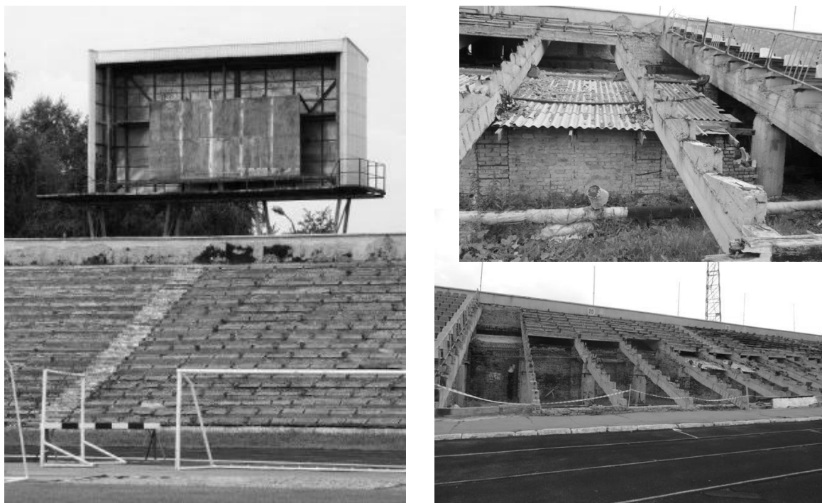
Рис. 1. Стан стадіону «Авангард», м. Рівне

Центральний багатофункціональний стадіон «Авангард», що знаходиться в м. Рівне на вул. Замкова, 34. Використовується для проведення футбольних матчів і легкоатлетичних змагань, є ареною проведення домашніх матчів місцевого футбольного клубу «Верес». У ХХ столітті це був стадіон місткістю 25-30 тисяч чоловік. Зараз на ньому немає навіть електронного табло, після дощів заливає приміщення під трибунами. Немає належних умов для спортсменів, тренерів, глядачів. Встановлено 4500 індивідуальних сидінь. Решта трибун в аварійному стані. Реконструкцію об'єкта розпочато 2002 року. Але досі більша частина трибун має такий вигляд: