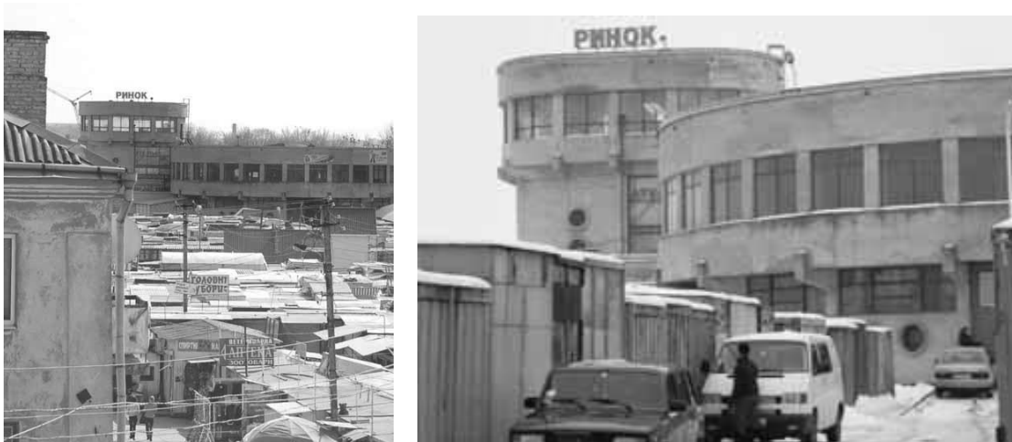
Рис. 3. Зовнішній вигляд перепрофільованої ДЮСШ.

На початку 1992 року кілька об'єктів для завершення будівництва і експлуатації за призначенням передали з балансу Рівненського міськвиконкому на баланс різних приватних структур.