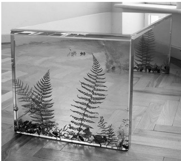
Іл.6. Стіл «Ferns table», Саша Сайкс, поч. 2000-х рр.[11]

4. Декор обладнання та меблів. Зокрема, зразками можуть бути елементи столів (Іл. 7), виготовлених українськими дизайнерами та ювелірами – братами Кочутами, і вже згадані роботи Саші Сайкс (рис. 6) [11, 14];