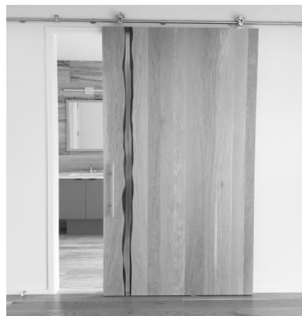
Іл.4. Двері, Алекс Бауман, 2017 [12]