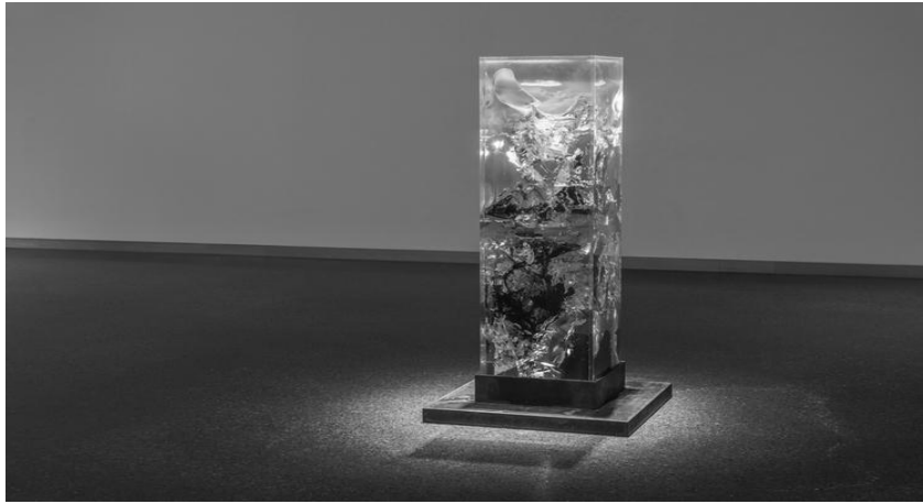
Іл.5. Скульптура «Synthesis 1 & 2», Том Прайс, 2014 [13]

3. Самостійна об'ємна скульптурна композиція. Наприклад, скульптура (Іл.5) експериментального англійського дизайнера Тома Прайса [13];