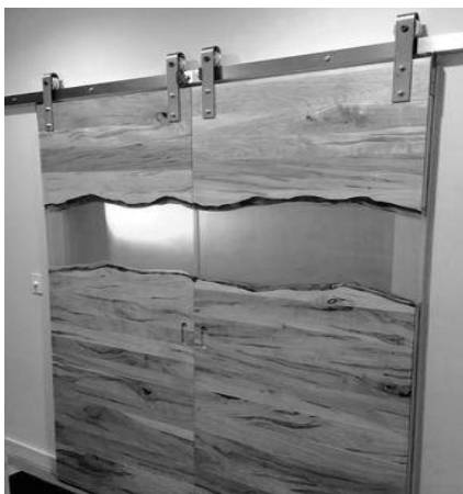
Іл.3. Двері, Алекс Бауман, 2017 [12]

2. Частина оздоблення архітектурних конструкцій (декорування стін, підлоги, стелі, дверей). Зокрема, такими є роботи (Іл. 3, 4) засновника Twochair Studio Алекса Баумана – американського дизайнера німецького походження [12];