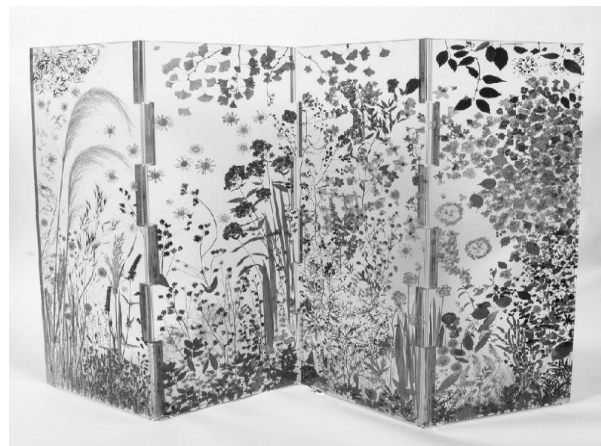
Іл.2. Перегородка «Bloom!», Саша Сайкс, 2017 [11]

2. Частина оздоблення архітектурних конструкцій (декорування стін, підлоги, стелі, дверей). Зокрема, такими є роботи (Іл. 3, 4) засновника Twochair Studio Алекса Баумана – американського дизайнера німецького походження [12];