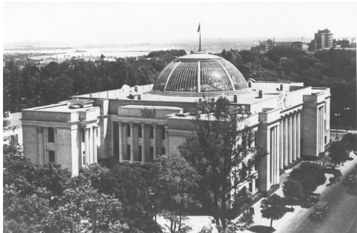
Рис. 3 Будинок Ради

Народних Комісарів УРСР. Арх. І. О. Фоміним і П. В. Абросімов. 1935 р.