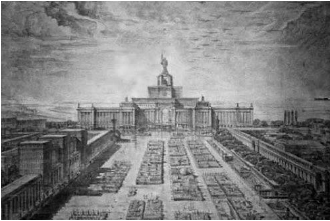
Рис. 1 Проект урядового кварталу. Арх. Д. Чечулін. 1934-1936 рр.