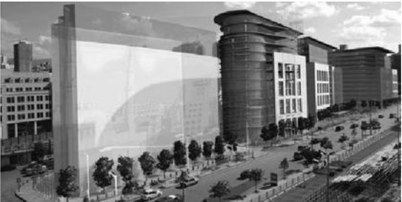
Рис. 4. Житловий комплекс «Ворота Бейруту» у Лівані, арх. К. де Портзампарк, арх. майстерня «Архітектоніка».