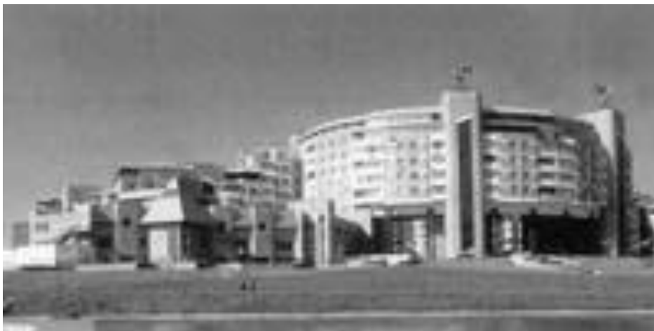
Рис. 6. Житловий комплекс «Синій Птах», Москва.

Житловий комплекс «Синій Птах», (Москва, 1997р.), розміщений в район комфортного проживання у 5-му мікрорайоні Північний Бутовий. Комплекс складається з житлових будинків змінної (4-10) поверховості та 22-поверхового будинку. Окрім житлових корпусів комплекс включає дитячий сад на 60 місць, школу із спортивним ухилом на 500 місць підземний двоповерховий гараж на 309 машиномісць, а також магазини, кафе і ресторани. (рис. 6). В цьому комплексі апробована схема створення забудовником кондомініуму.