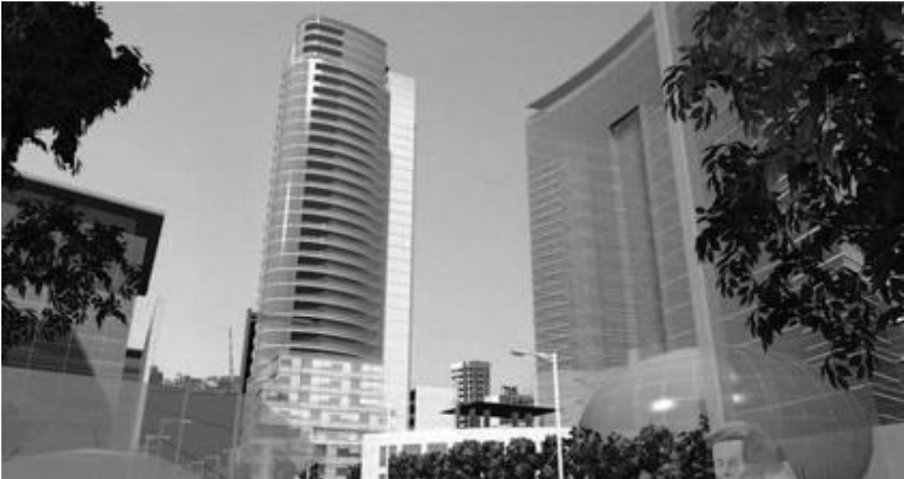
Рис. 3. Житловий комплекс «Ворота Бейруту» у Лівані, арх. К. де Портзампарк, арх. майстерня «Архітектоніка».

житловим будинком у центрі. Дах цього квадрата засаджений газоном, межі якого формуються рядами секційних будинків (рис. 5).