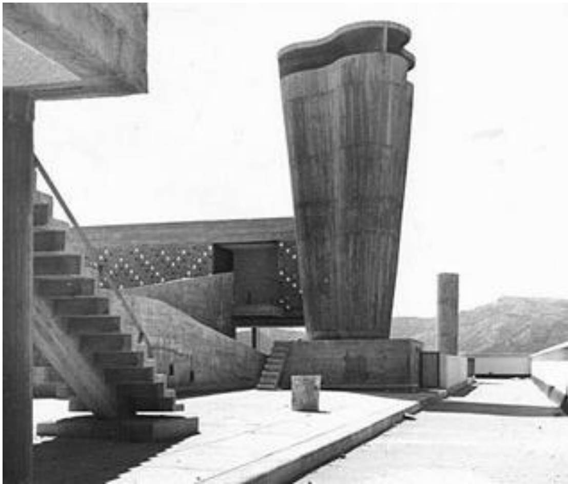
Рис. 2. Житловий комплекс в Марселі, арх. Ле Корбюзьє (на покрівлі).

Наприкінці 60-х років ХХ століття у Франції піднялася хвиля протестів проти основного принципу розміщення масового житла - тріади (метро, місце праці, житло). Надалі держава відмовилася від створення великих ансамблів, що охопили Францію на той час, на користь ідеї нового міста розробкою яких активно велася архітекторами.