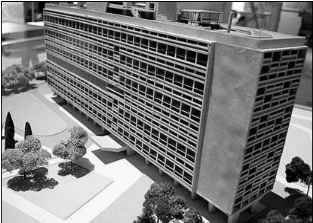
Рис. 1. Житловий комплекс в Марселі, арх. Ле Корбюзьє (макет).

Марсельський блок був задуманий як експериментальний будинок з ідеєю колективного мешкання. У центральній частині будівлі по вертикалі розташований комплекс, де є кафетерій, бібліотека, пошта, продуктові магазини та інші види послуг. На 17 поверсі розташовувався дитячий садок. Звідти пандус веде на терасу з кімнатою відпочинку, басейном та ігровими майданчиками.