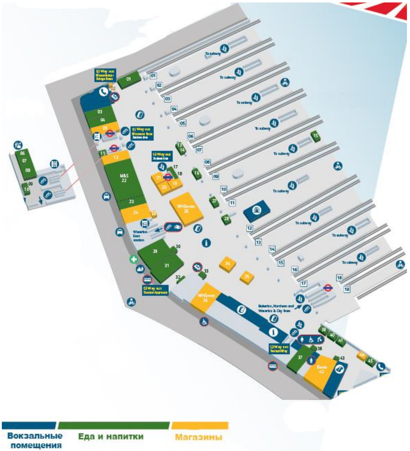
Рис. 2 Схема планировки. Вокзал Ватерлоо в Лондоне. Архитектор Н.Гримшоу